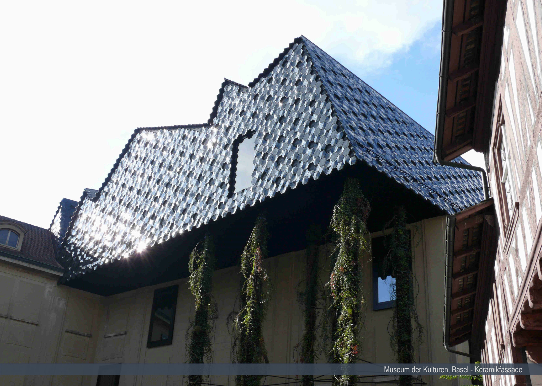
Museum der Kulturen, Basel - Keramikfassade