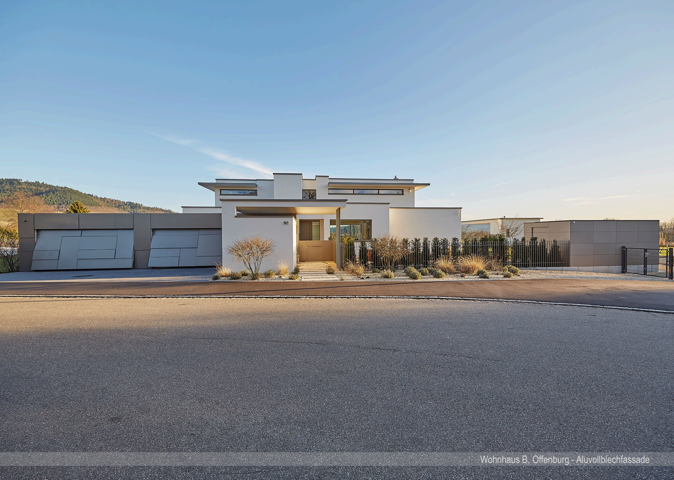
Wohnhaus B, Offenburg - Aluvollblechfassade