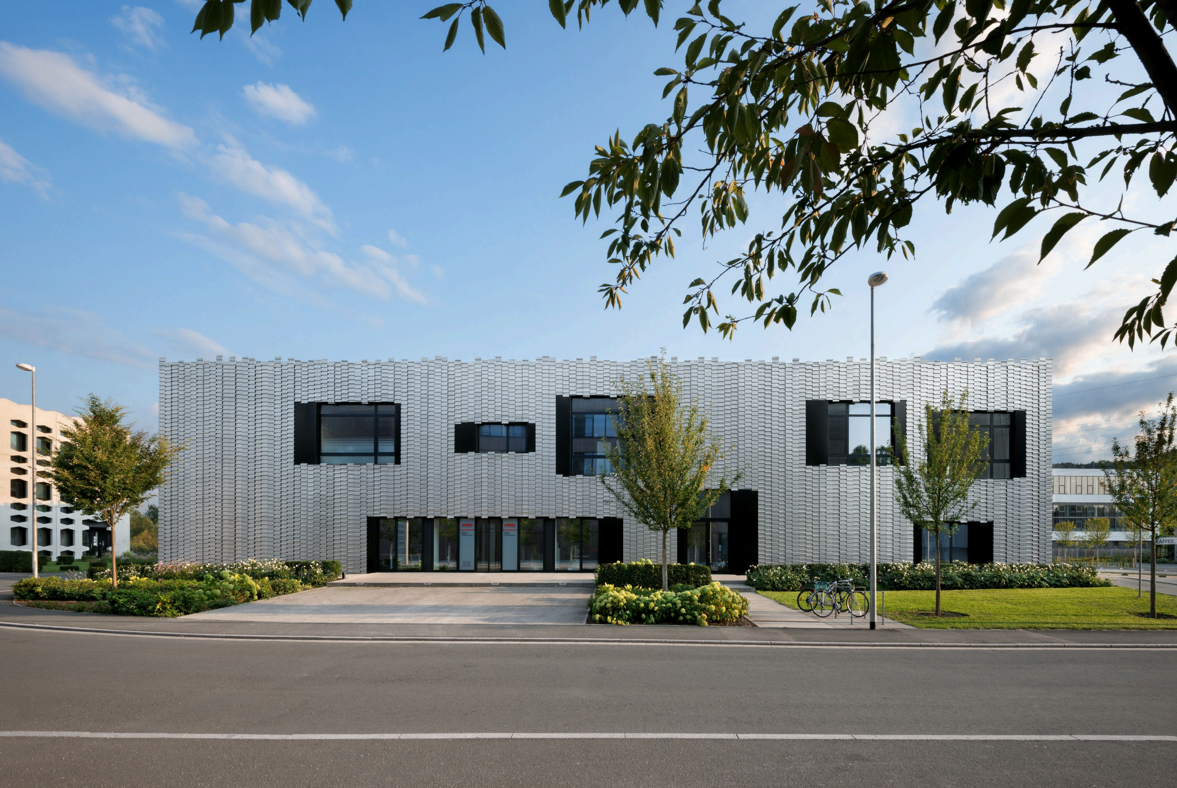
Christoplan, Jena - Trapezblechfassade