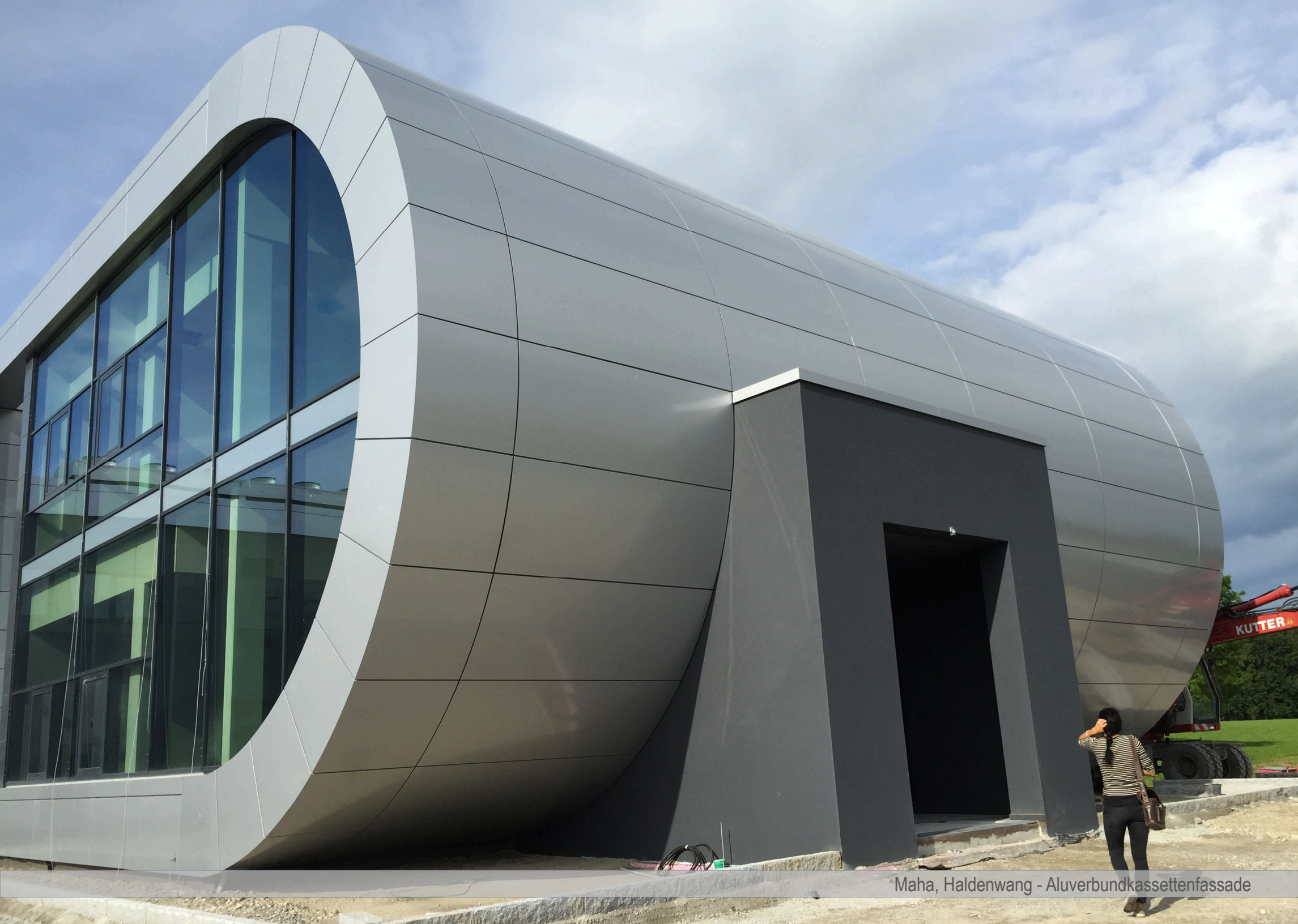
Maha, Haldenwang - Aluverbundkassettenfassade