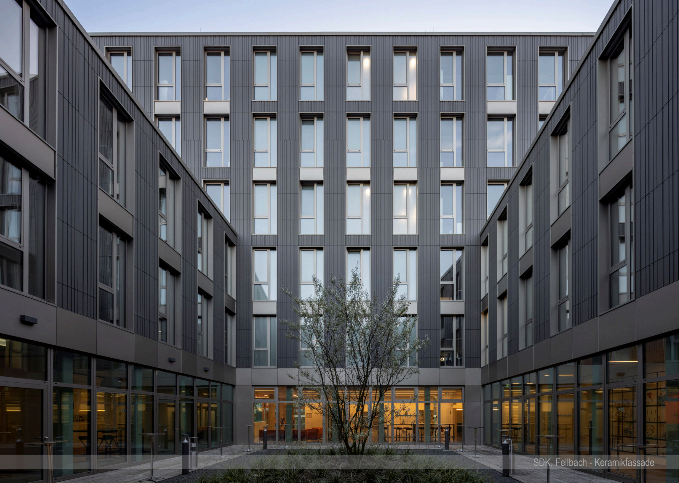
SDK, Fellbach - Keramikfassade