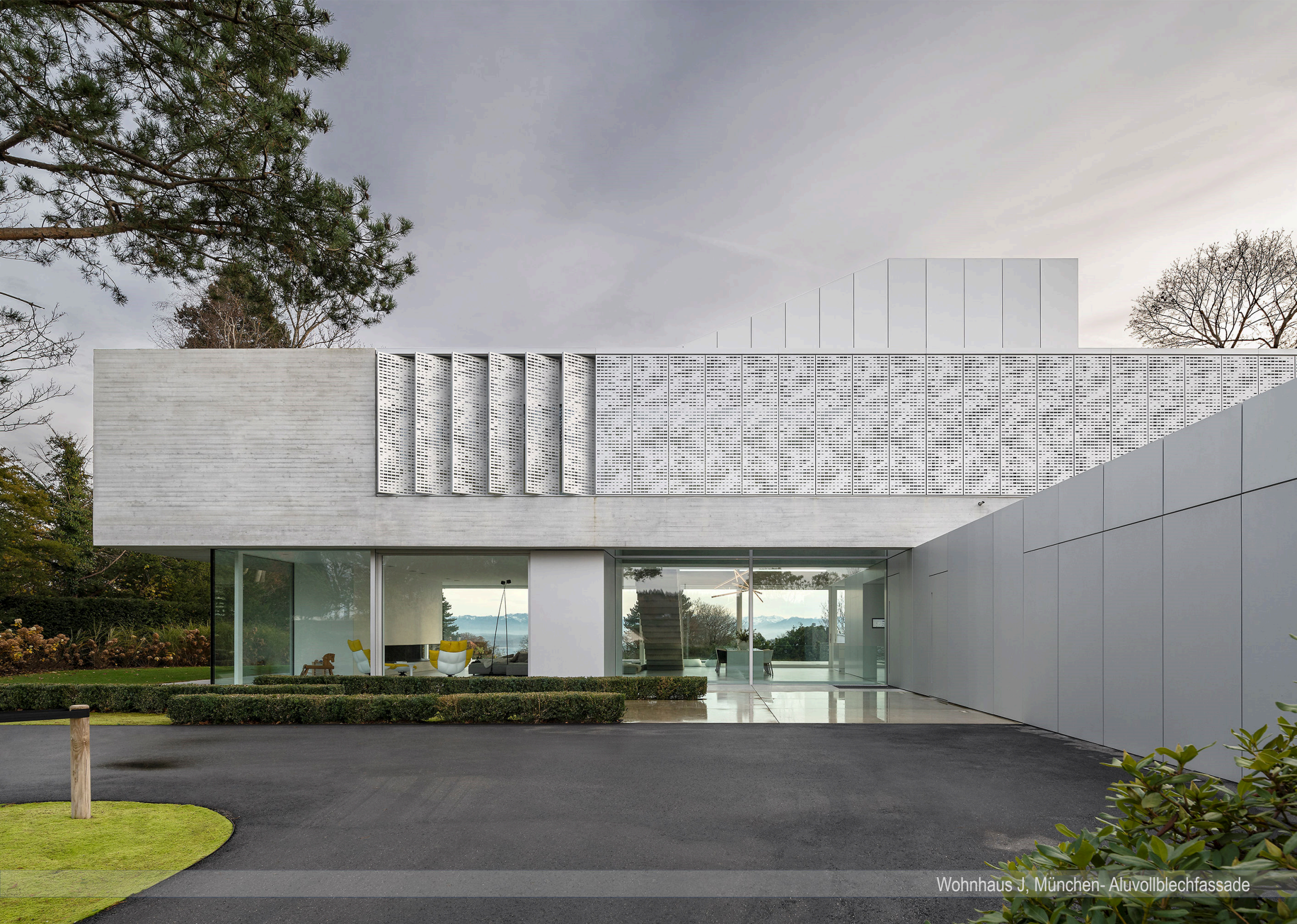
Wohnhaus J, München- Aluvollblechfassade