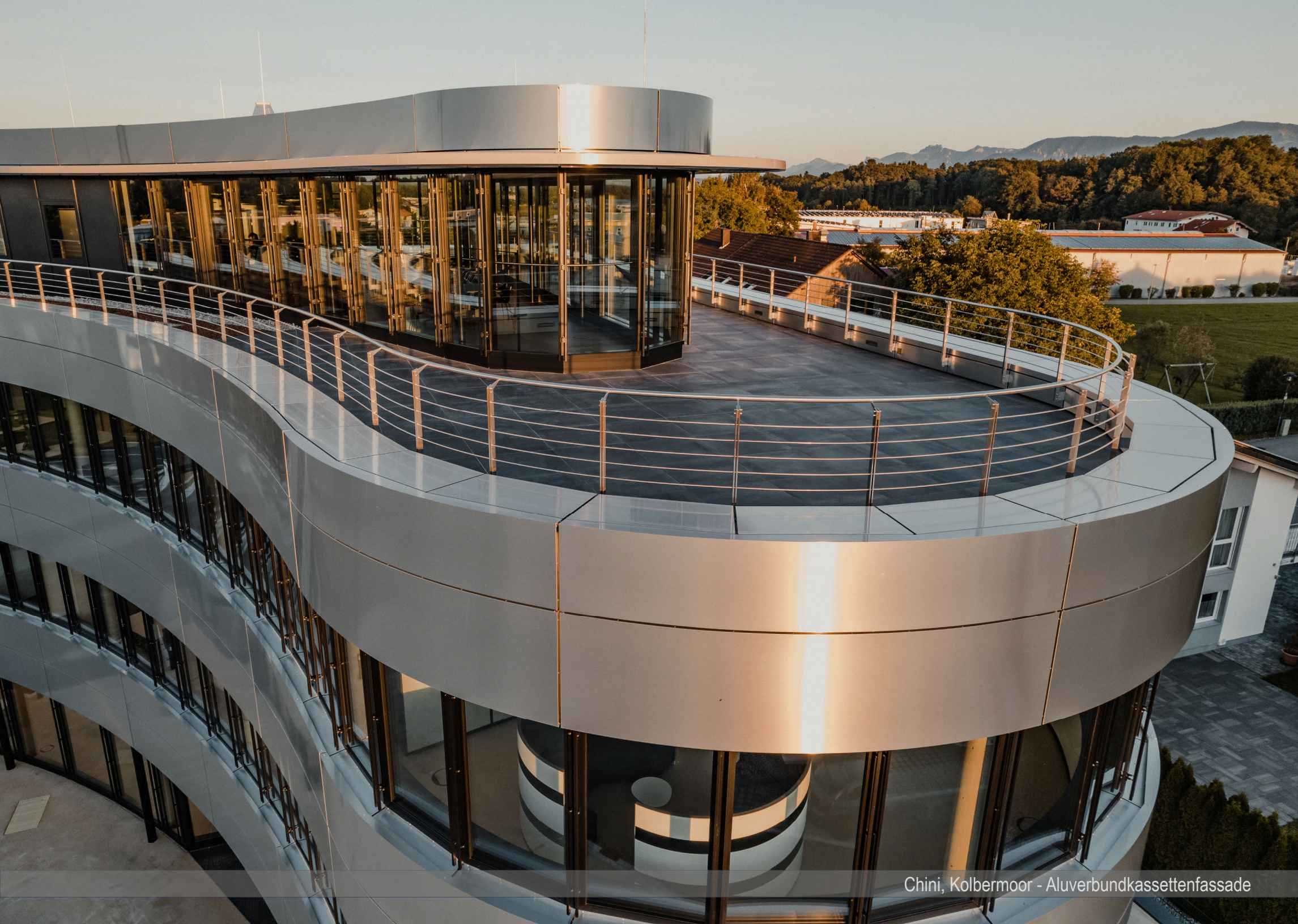
Chini, Kolbermoor - Aluverbundkassettenfassade