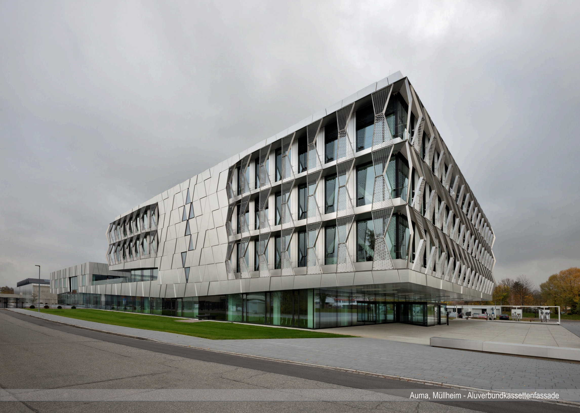
Auma, Müllheim - Aluverbundkassettenfassade