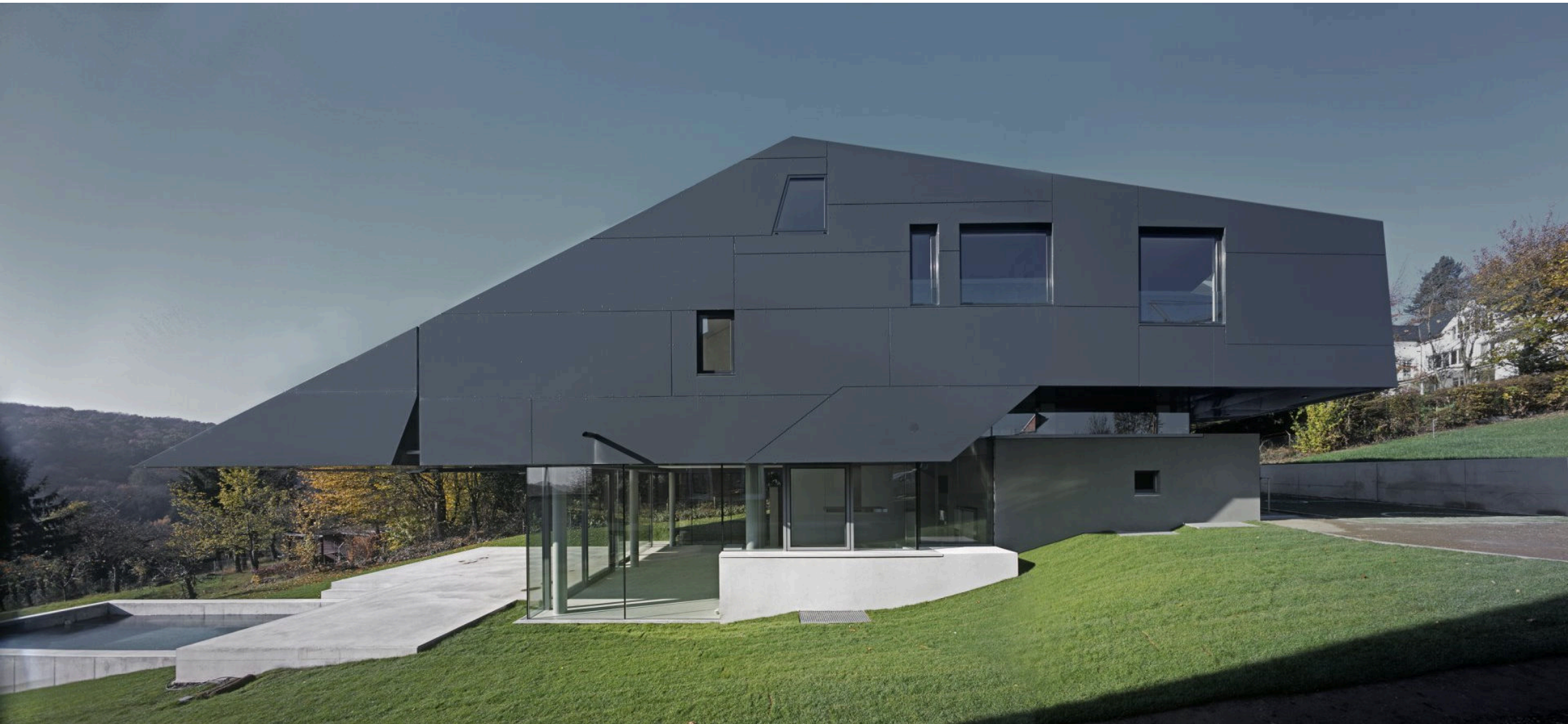
Wohnhaus F, Frankfurt - Aluverbundfassade