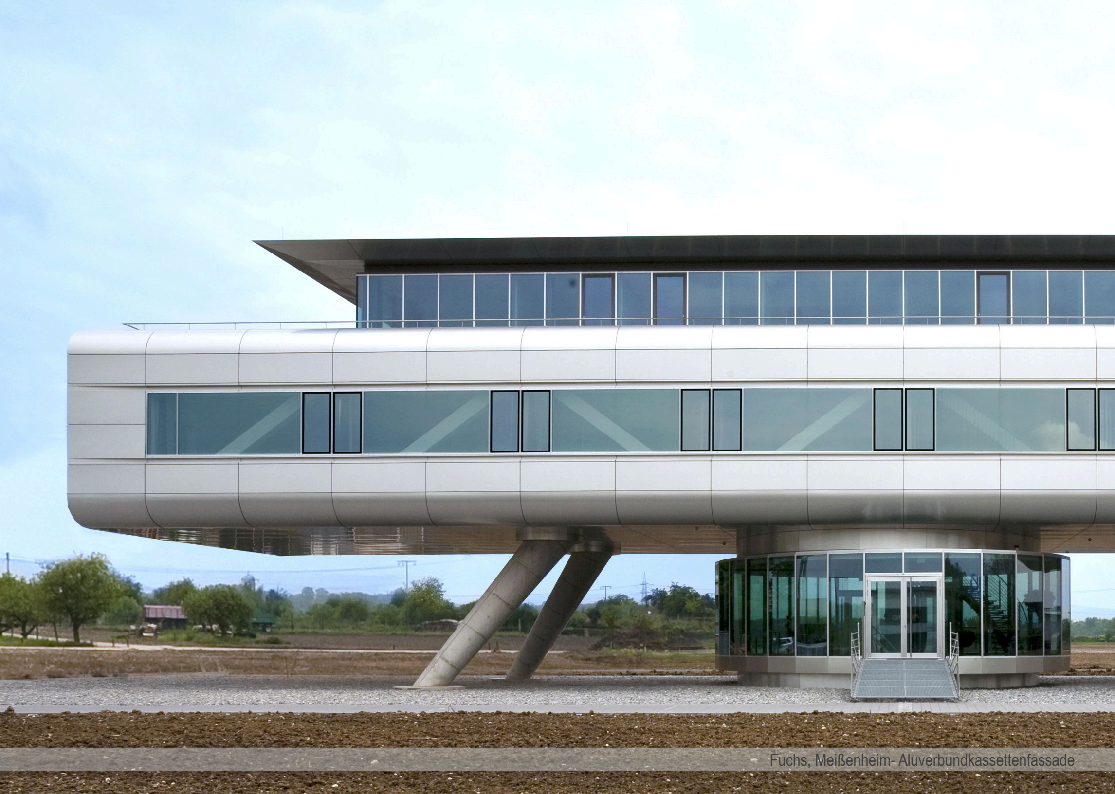
Fuchs, Meißenheim- Aluverbundkassettenfassade