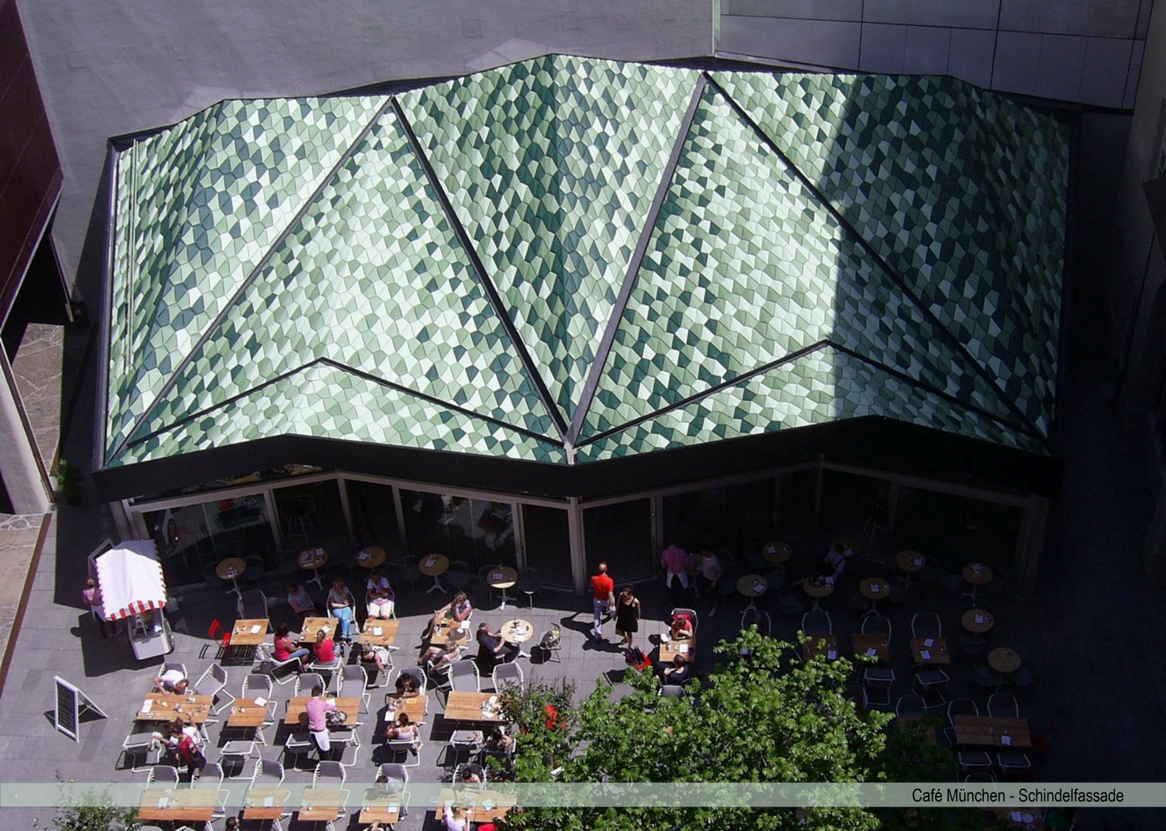
Café München - Schindelfassade