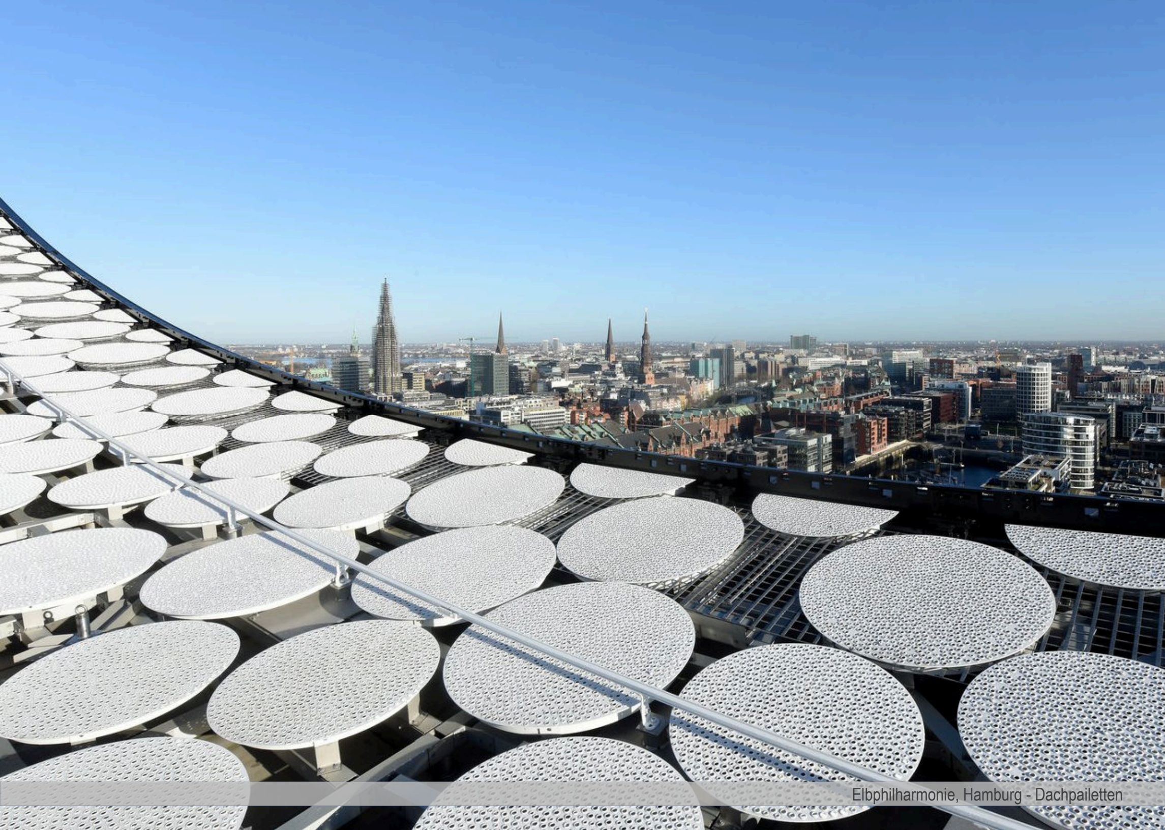
Elbphilharmonie, Hamburg - Dachpailletten