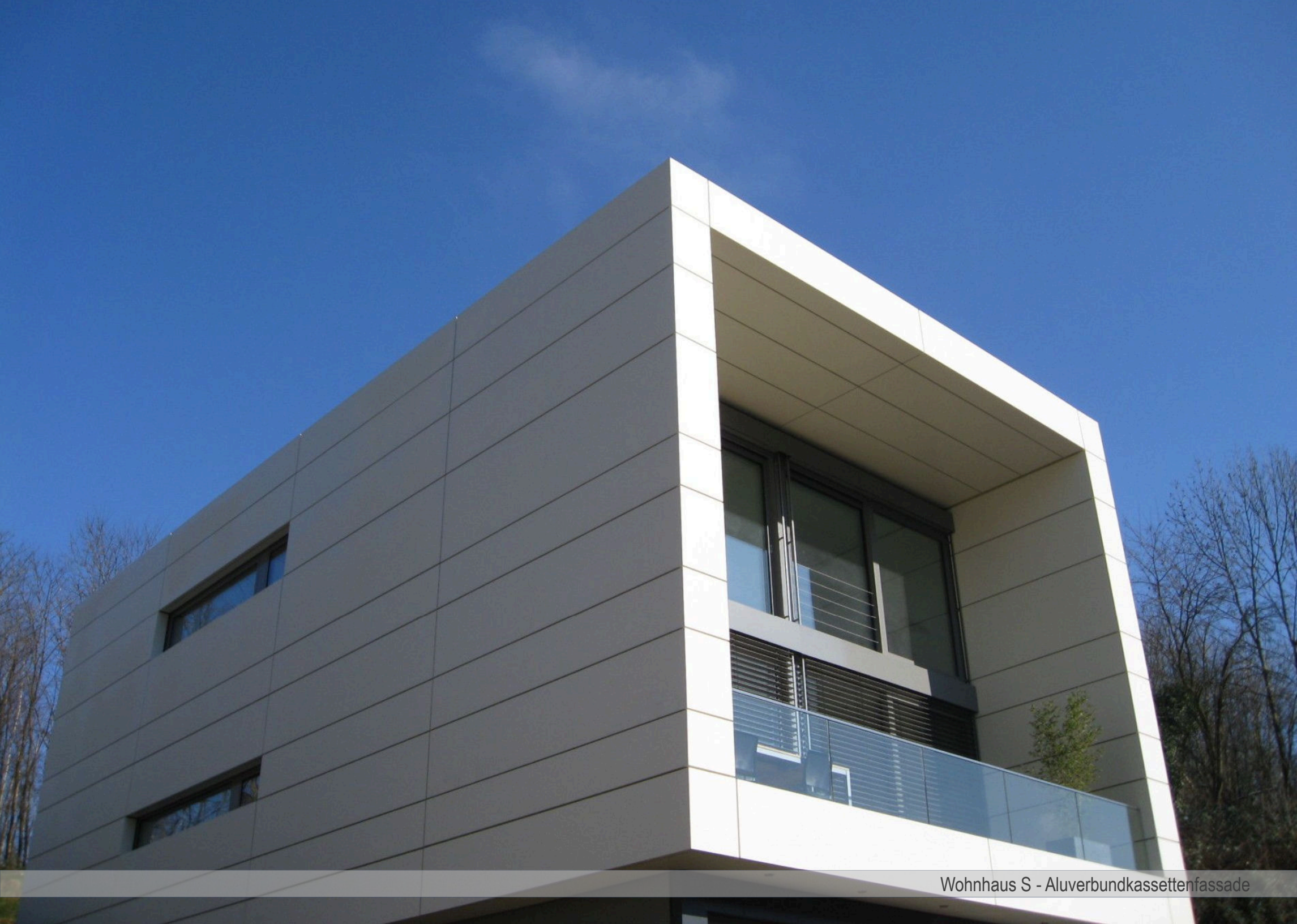
Wohnhaus S - Aluverbundkassettenfassade