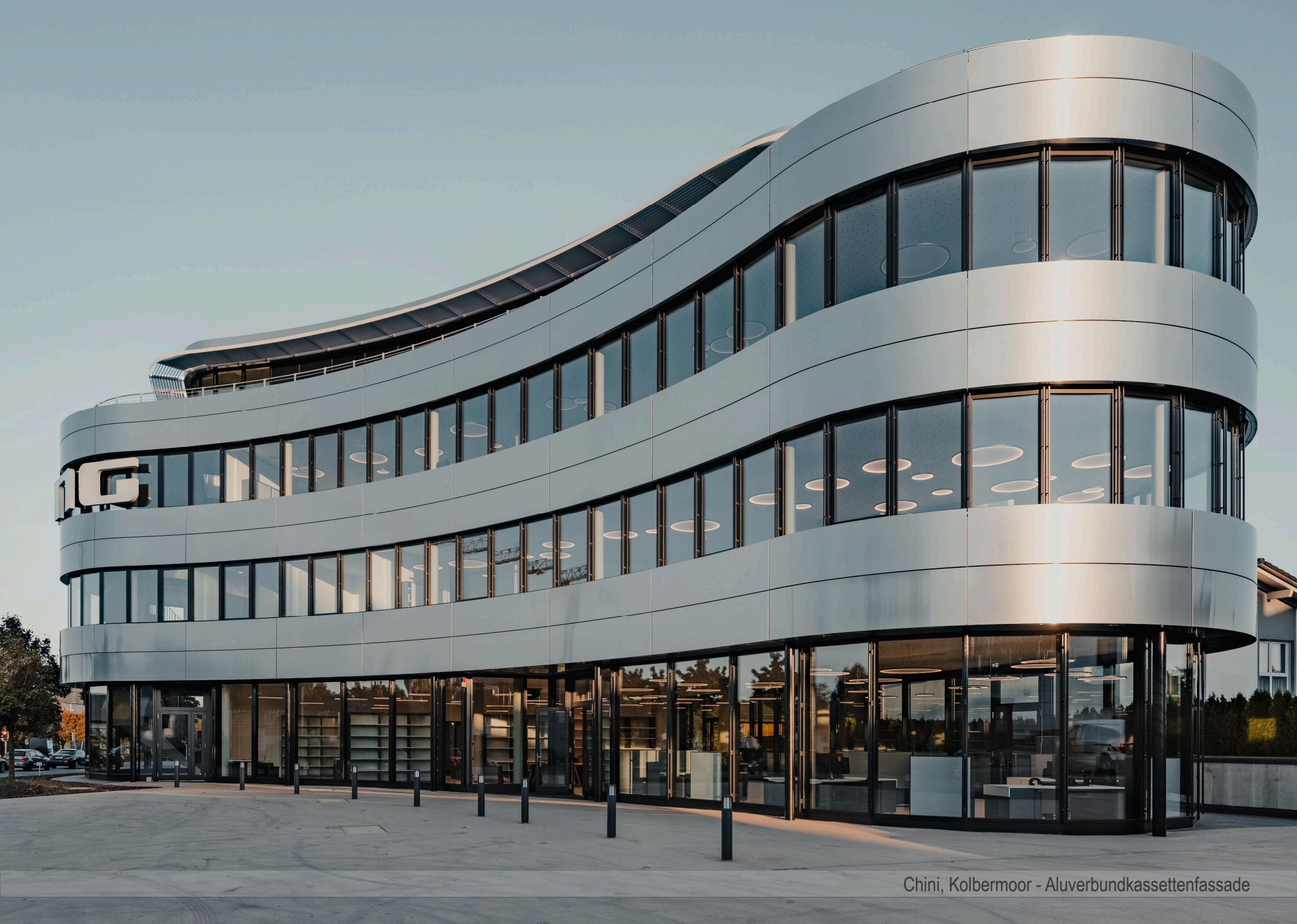
Chini, Kolbermoor - Aluverbundkassettenfassade