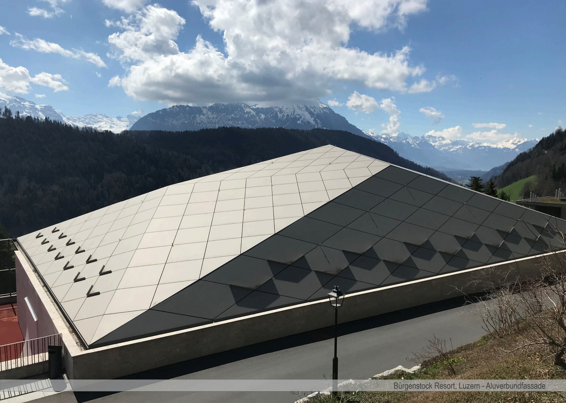
Bürgenstock Resort, Luzern - Aluverbundfassade