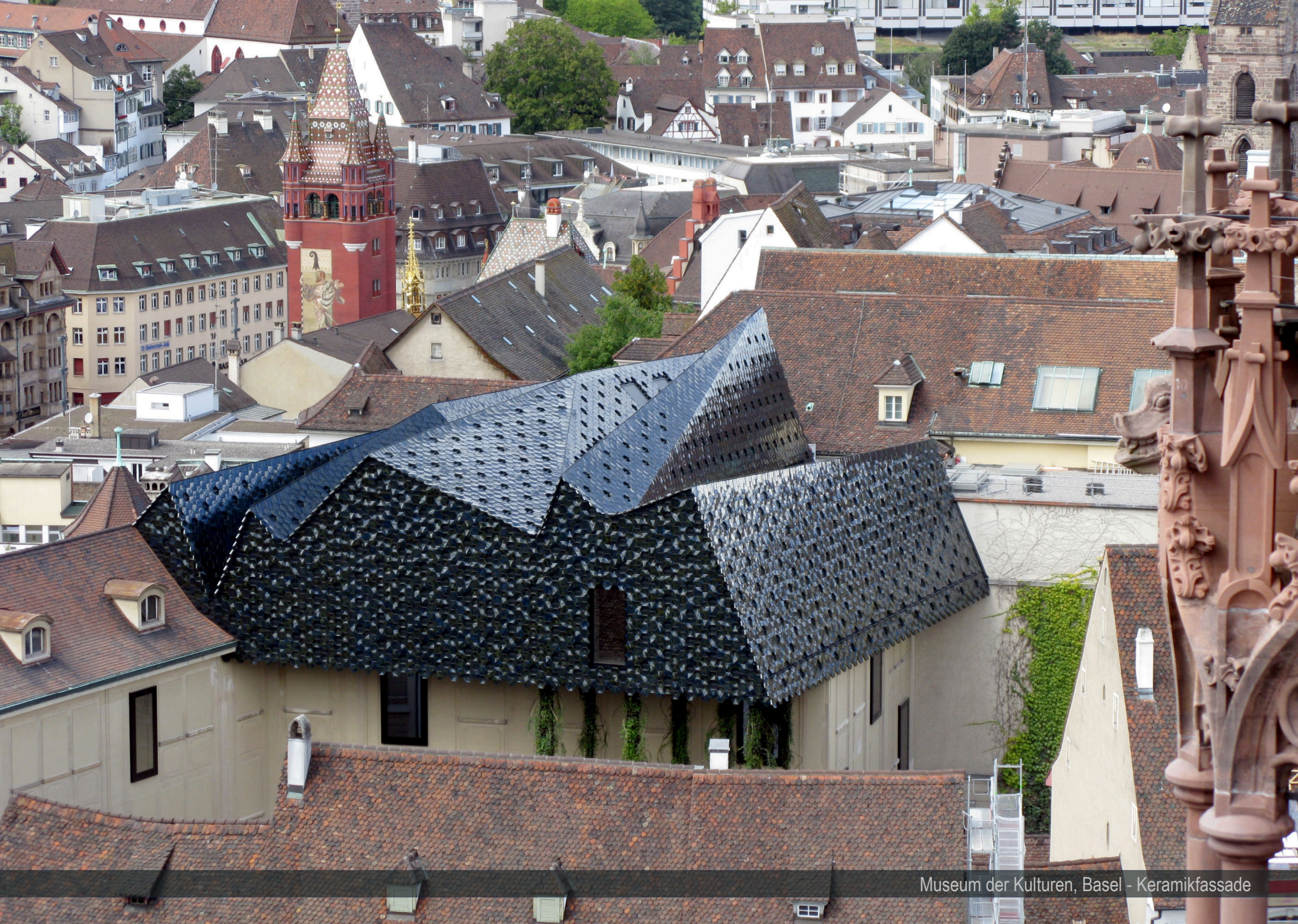
Museum der Kulturen, Basel - Keramikfassade