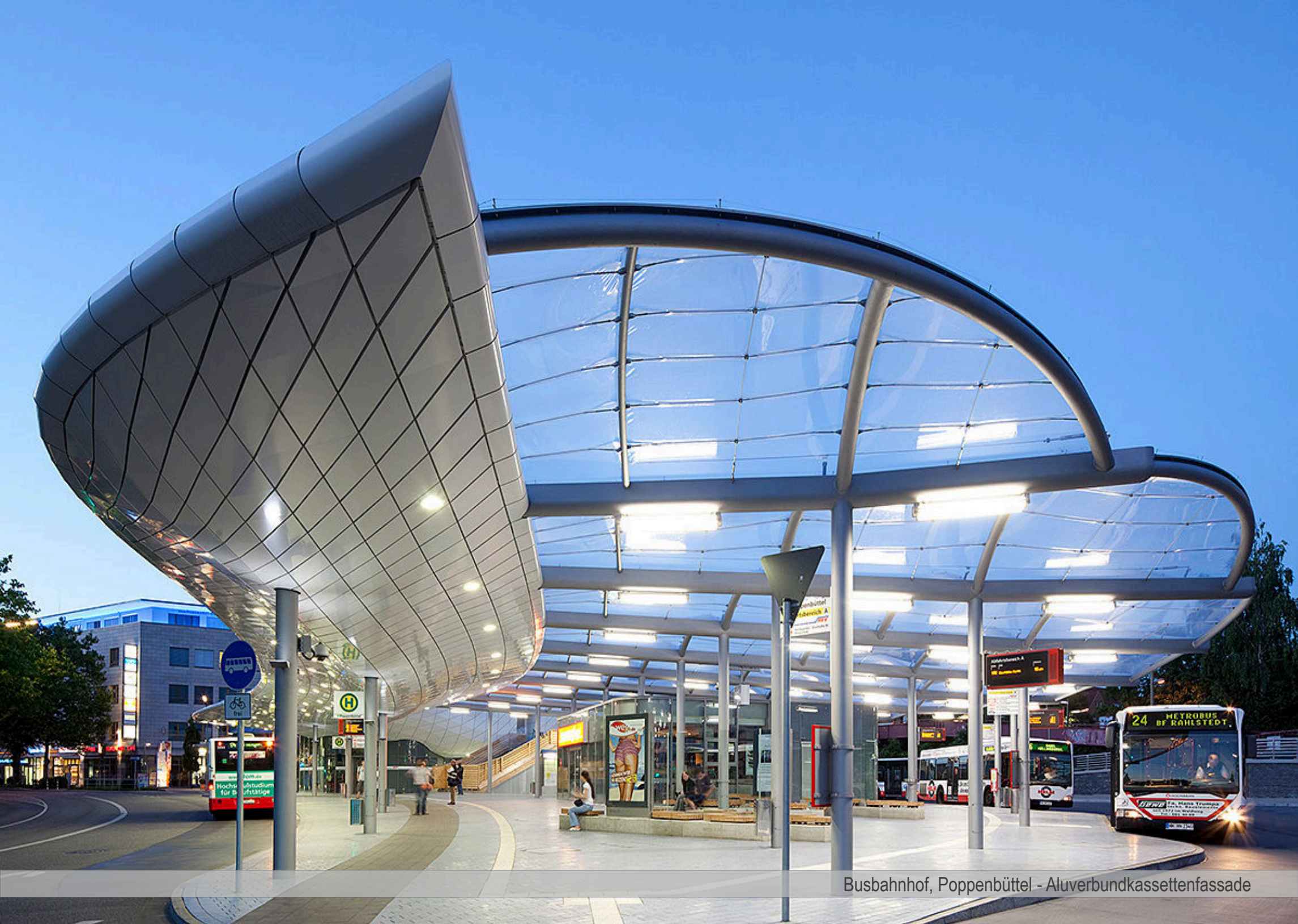
Busbahnhof, Poppenbüttel - Aluverbundkassettenfassade