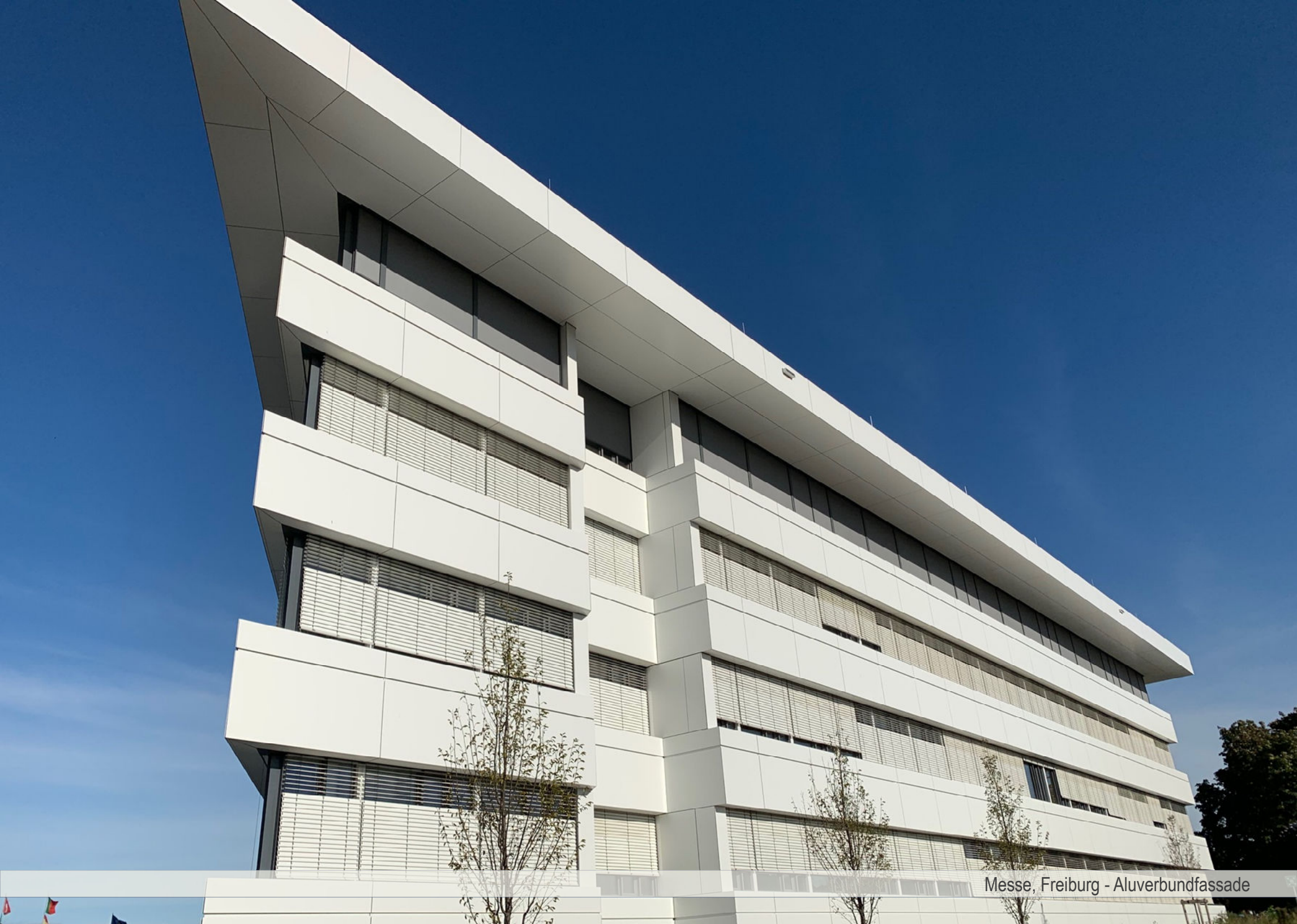
Messe, Freiburg - Aluverbundfassade