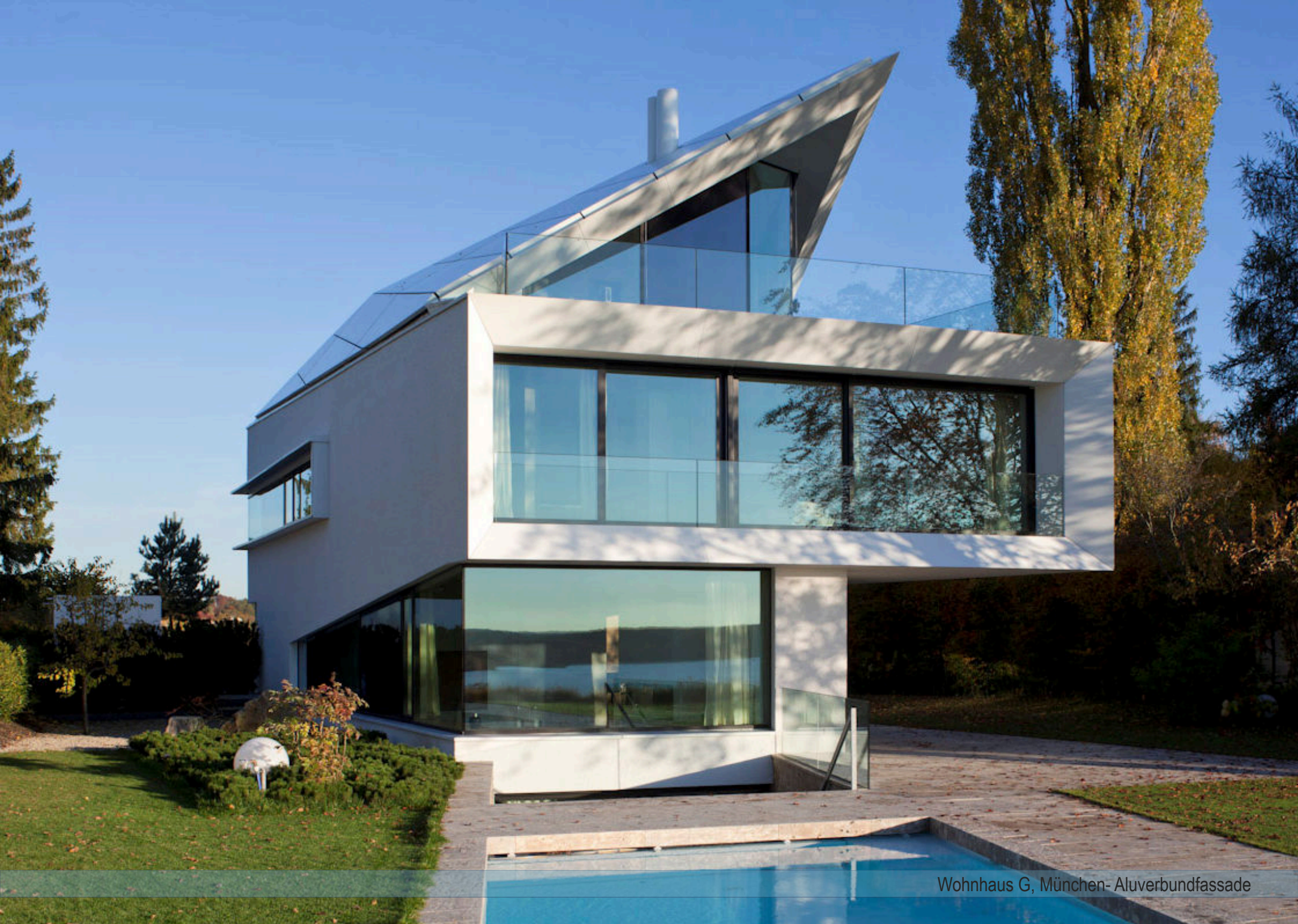
Wohnhaus G, München- Aluverbundfassade