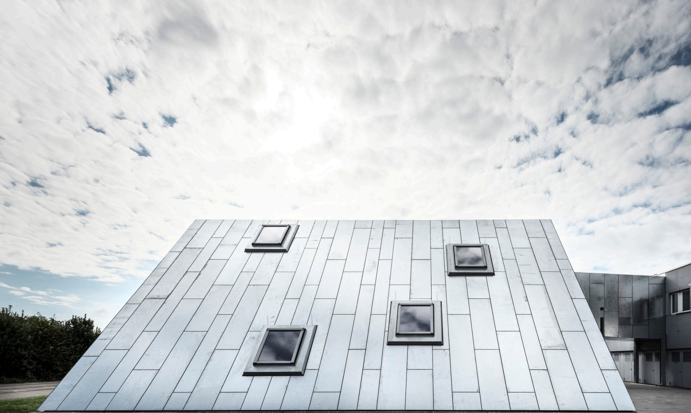
Roto, Bad Mergentheim – Stahlfassade feuerverzinkt