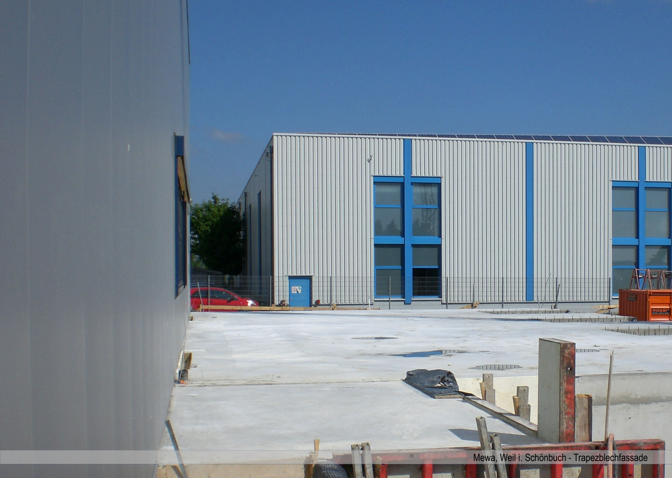
Mewa, Weil i. Schönbuch - Trapezblechfassade