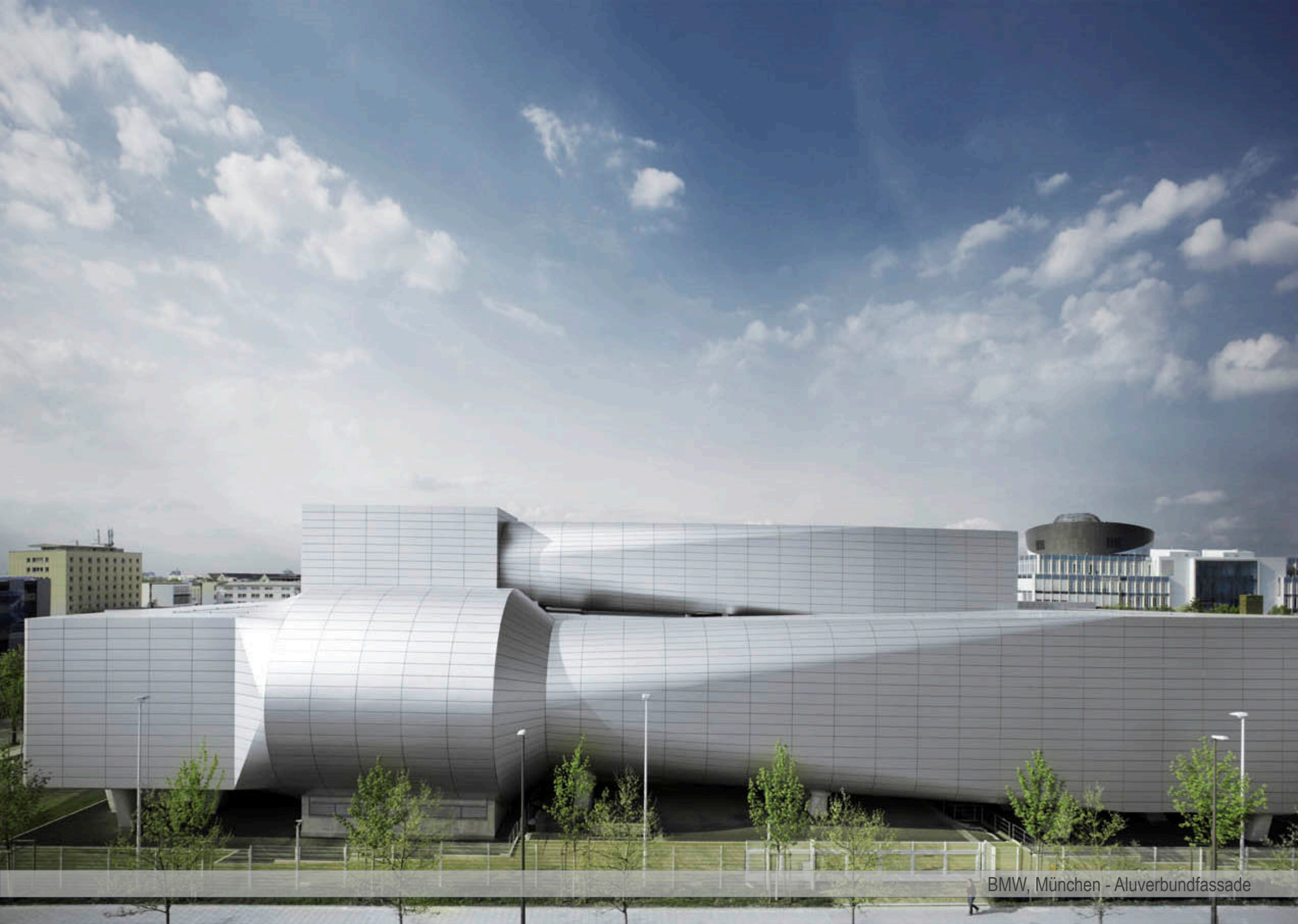
BMW, München - Aluverbundfassade