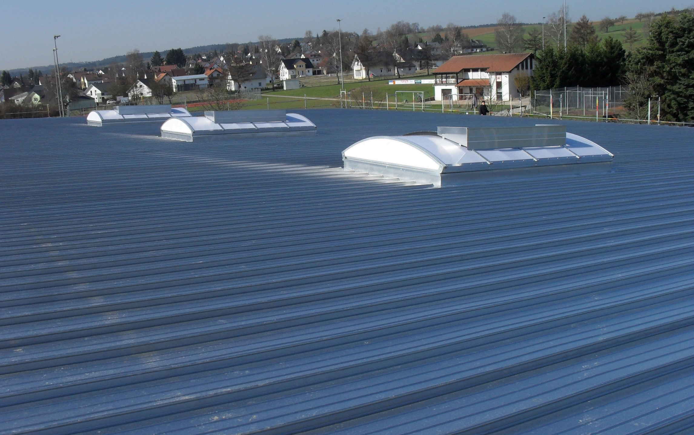
Sporthalle, Deisslingen - Stehfalzdach