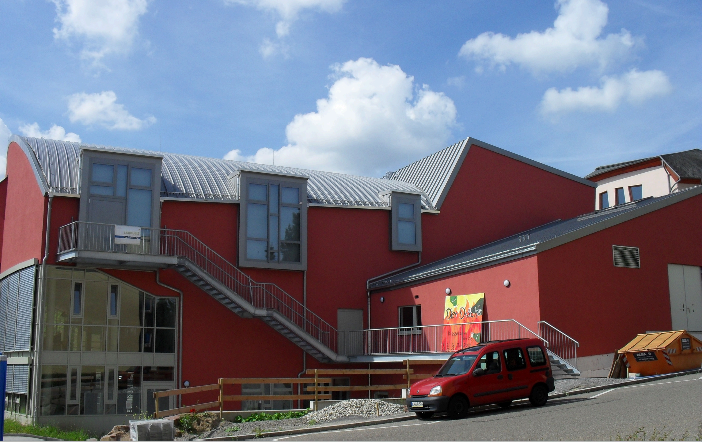
Mensa, Pforzheim - Stehfalzdach