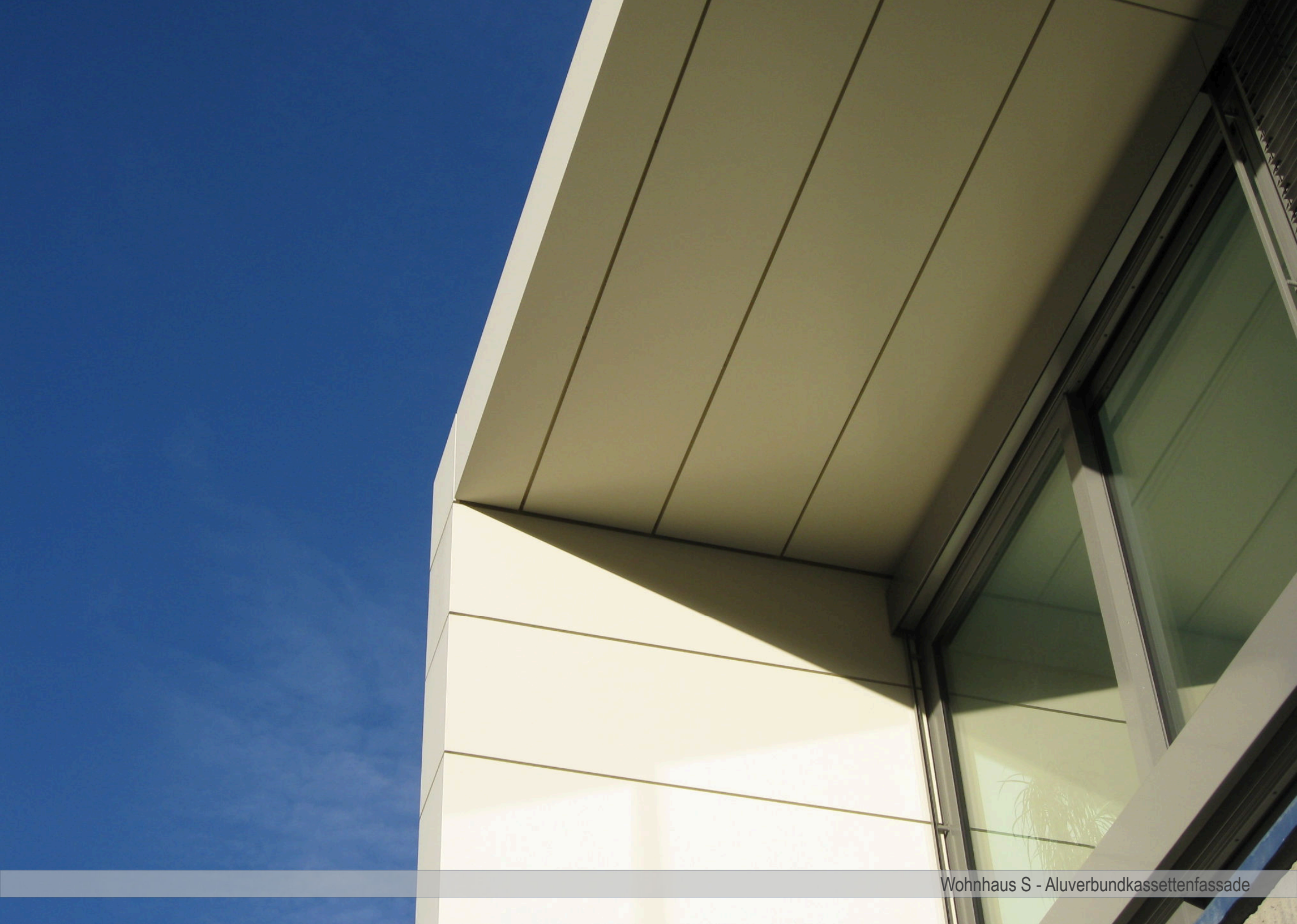
Wohnhaus S - Aluverbundkassettenfassade