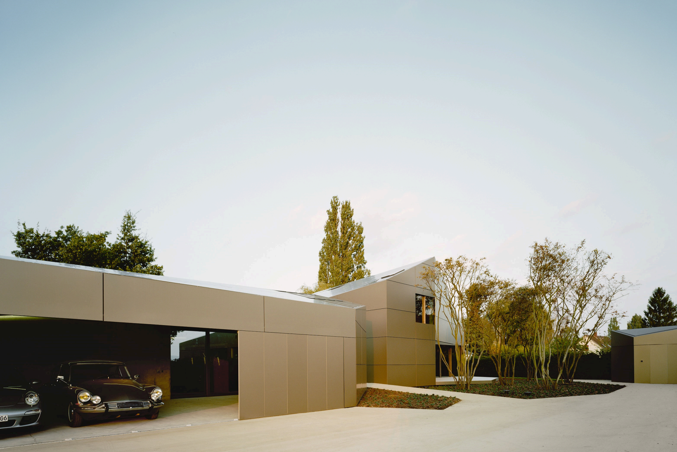
Wohnhaus P, Bodensee - Aluverbundkassettenfassade