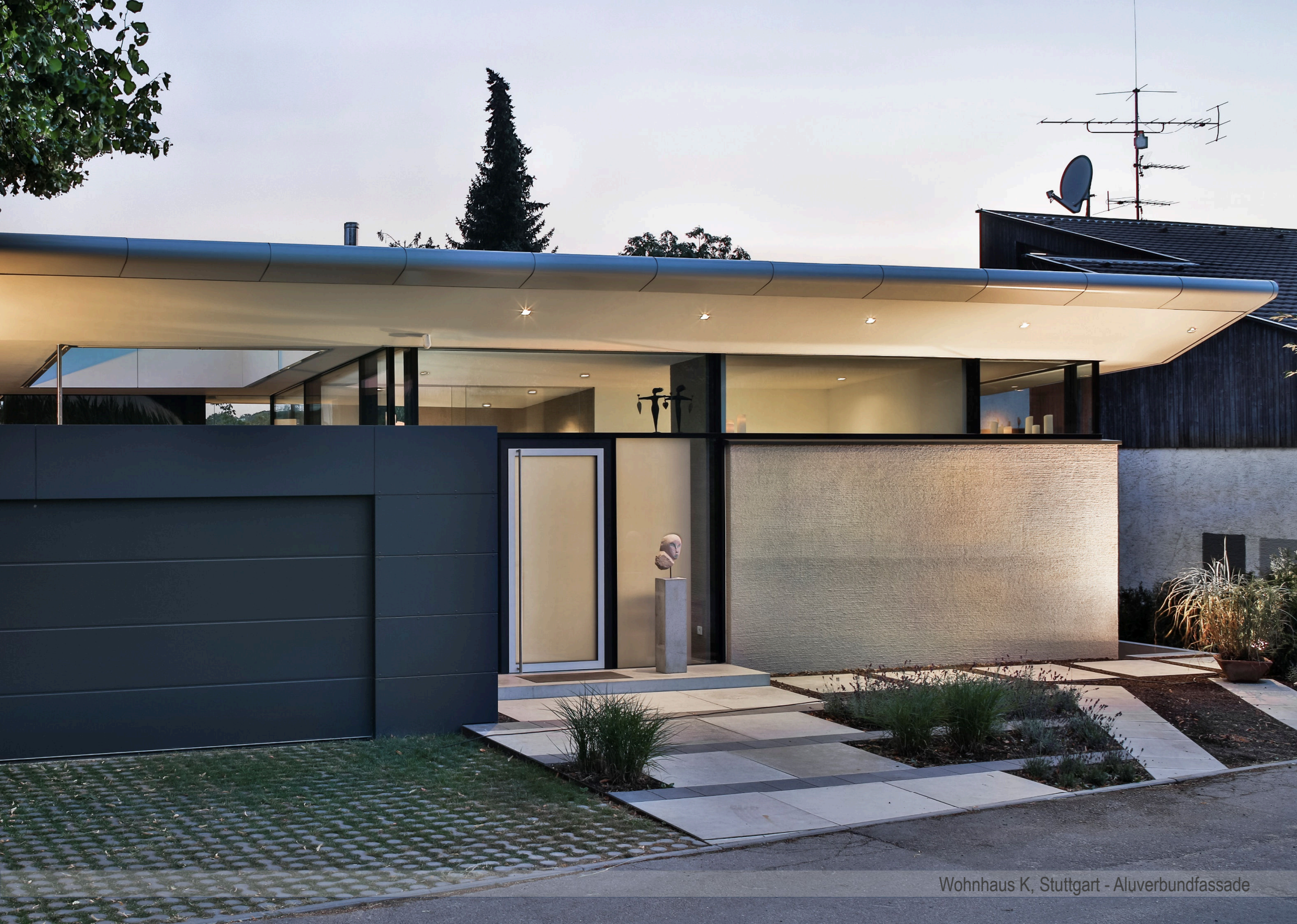
Wohnhaus K, Stuttgart - Aluverbundfassade