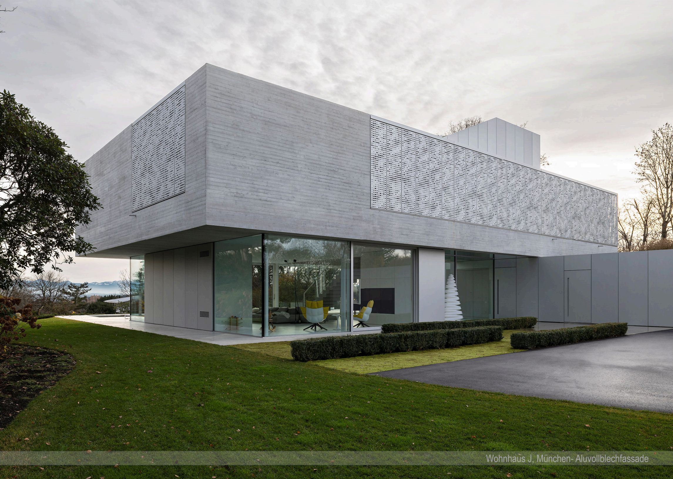
Wohnhaus J, München- Aluvollblechfassade