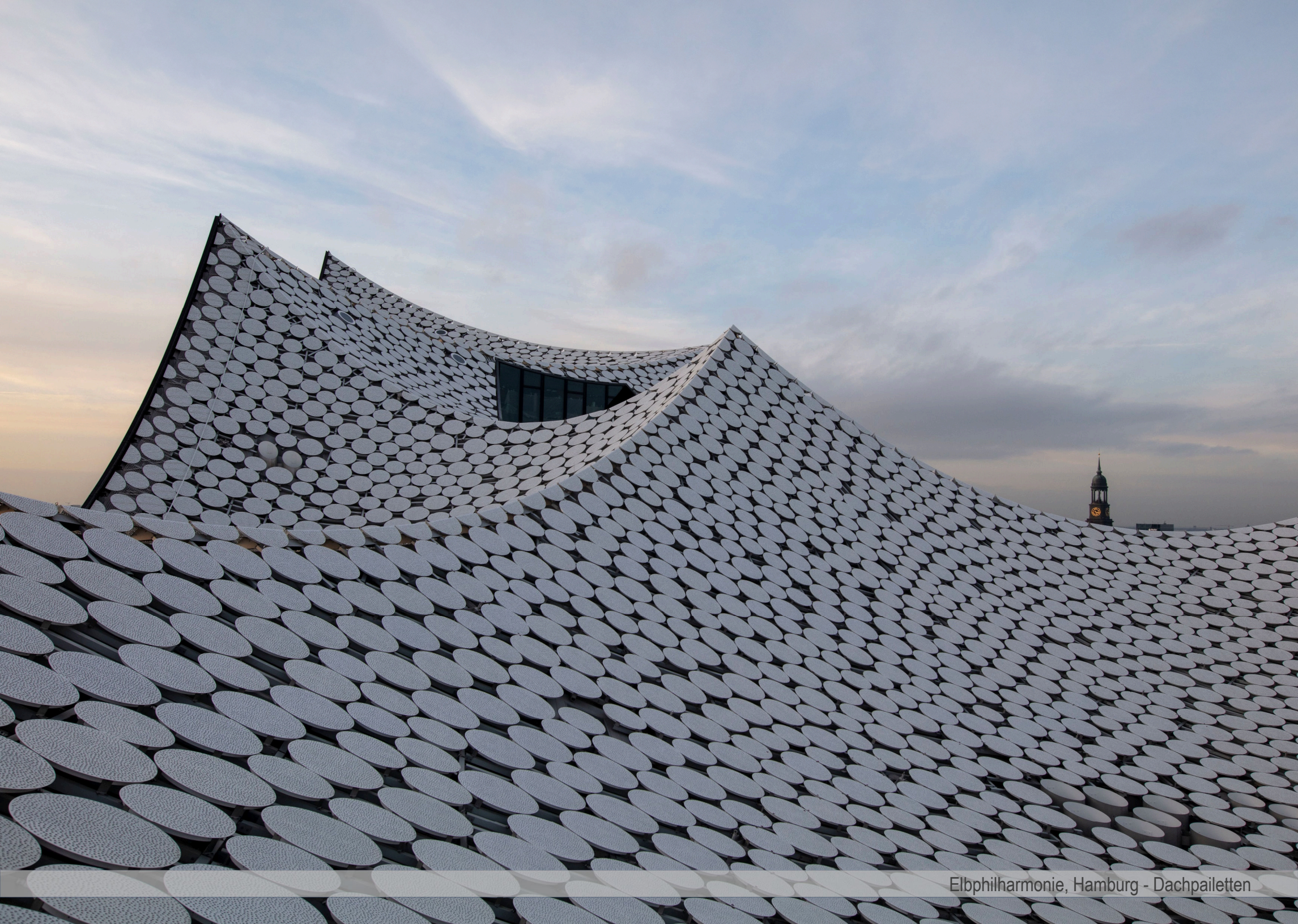
Elbphilharmonie, Hamburg - Dachpailletten