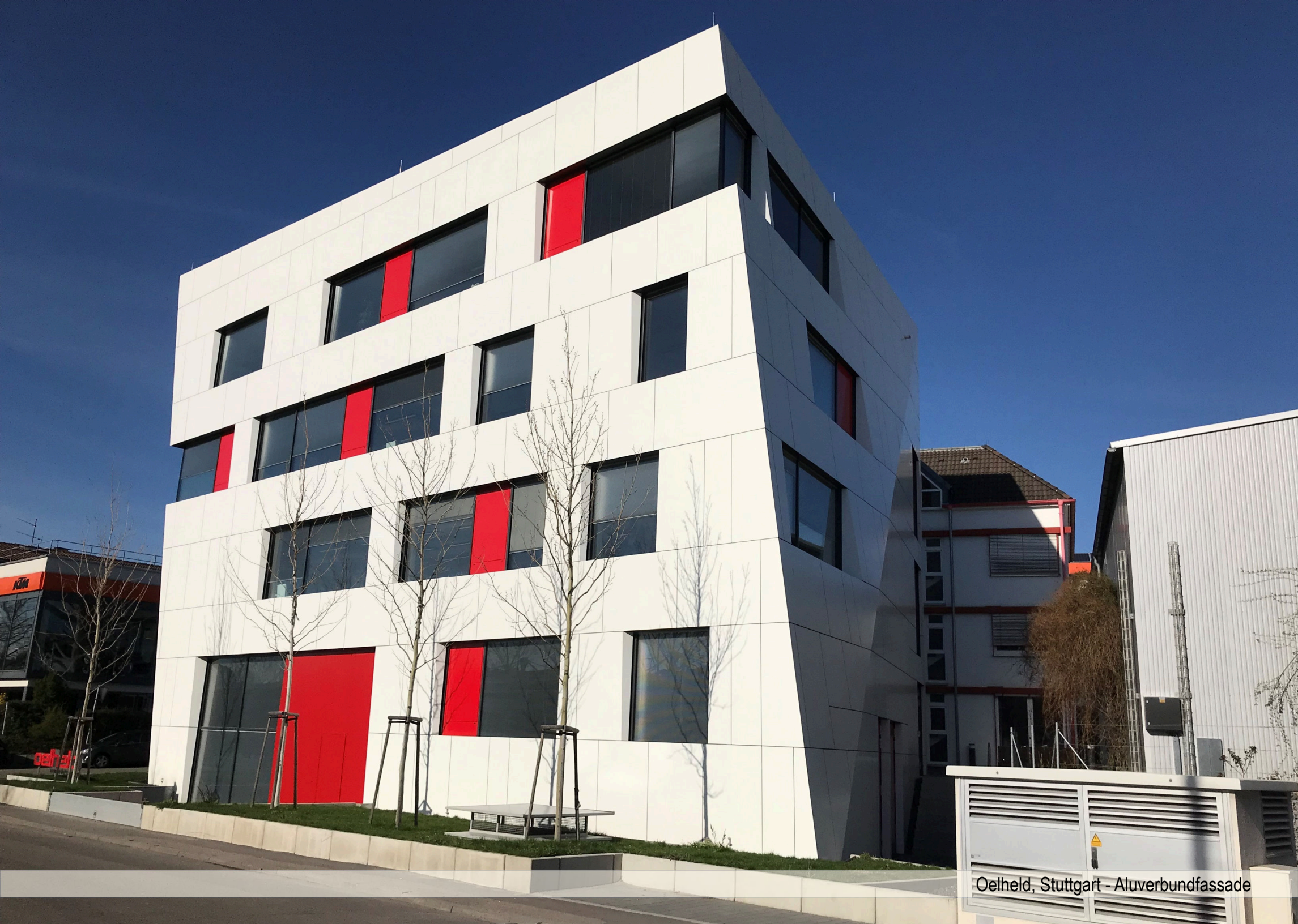
Oelheld, Stuttgart - Aluverbundfassade