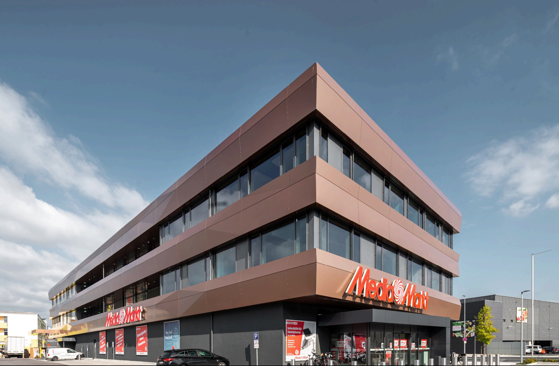
Sparkasse, Bad Neustadt - Aluverbundkassettenfassade