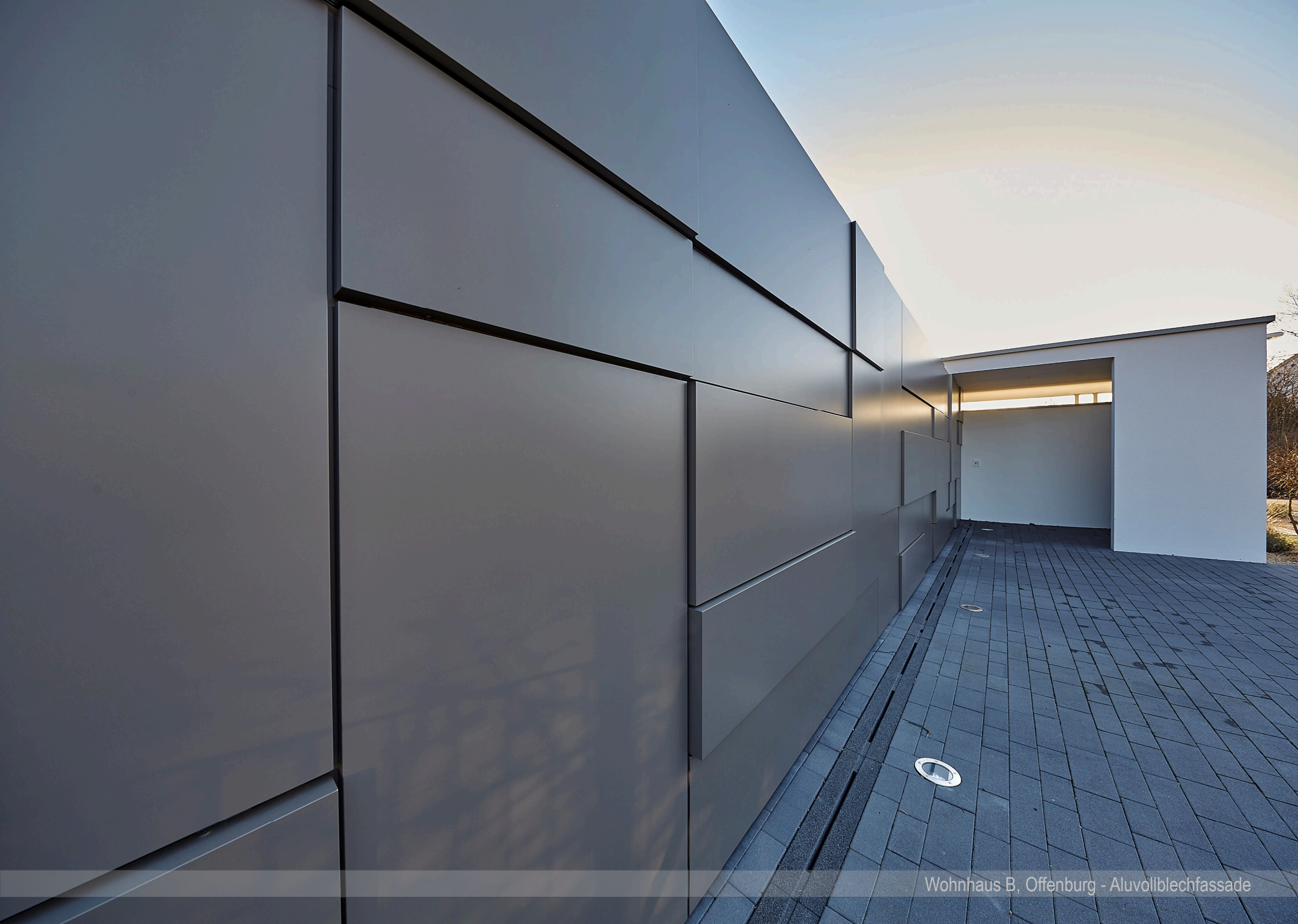
Wohnhaus B, Offenburg - Aluvollblechfassade