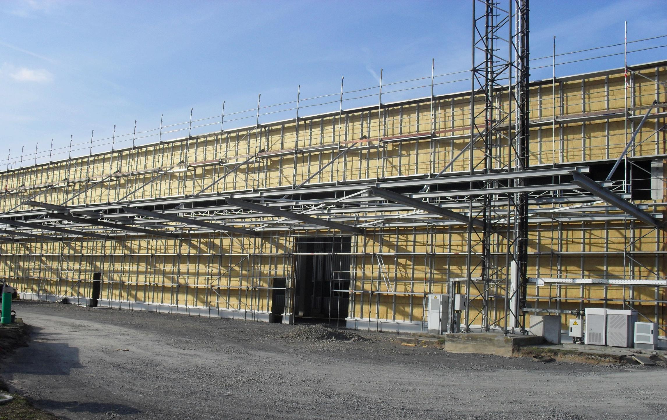
Hartmann u. König – Trapezblechvordach / Paneelfassade