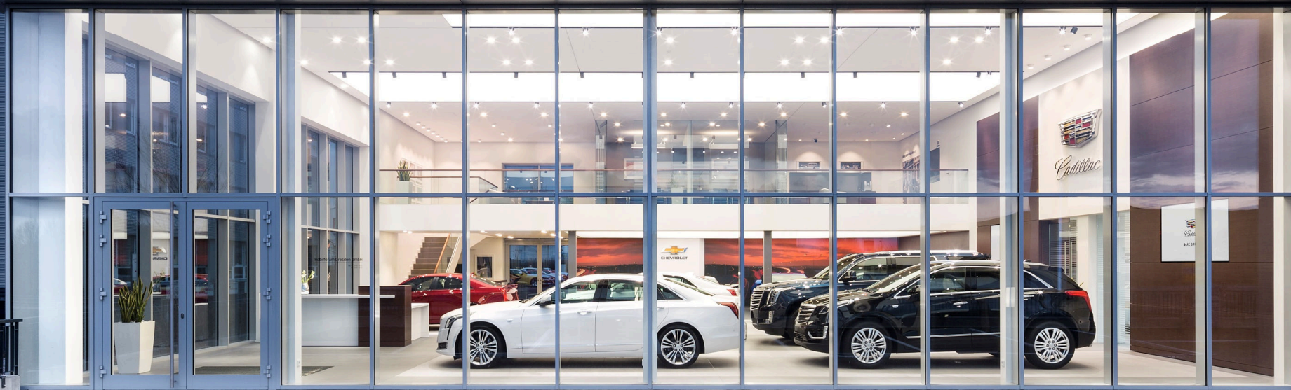
Cadillac, Dresden- Aluverbundkassettenfassade