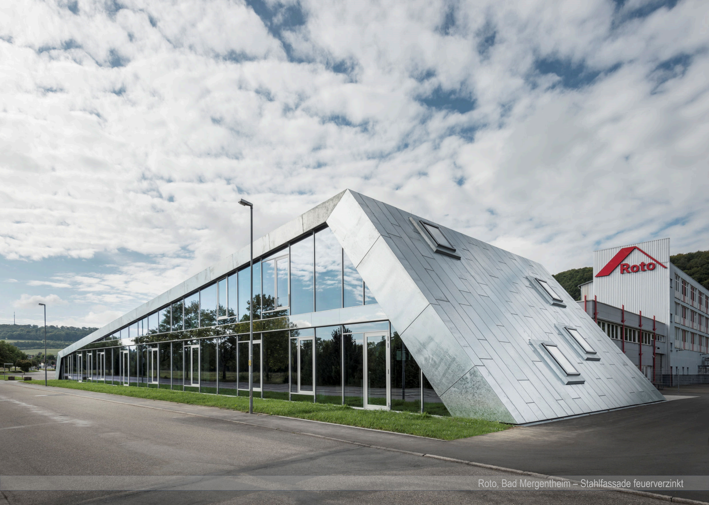
Roto, Bad Mergentheim – Stahlfassade feuerverzinkt