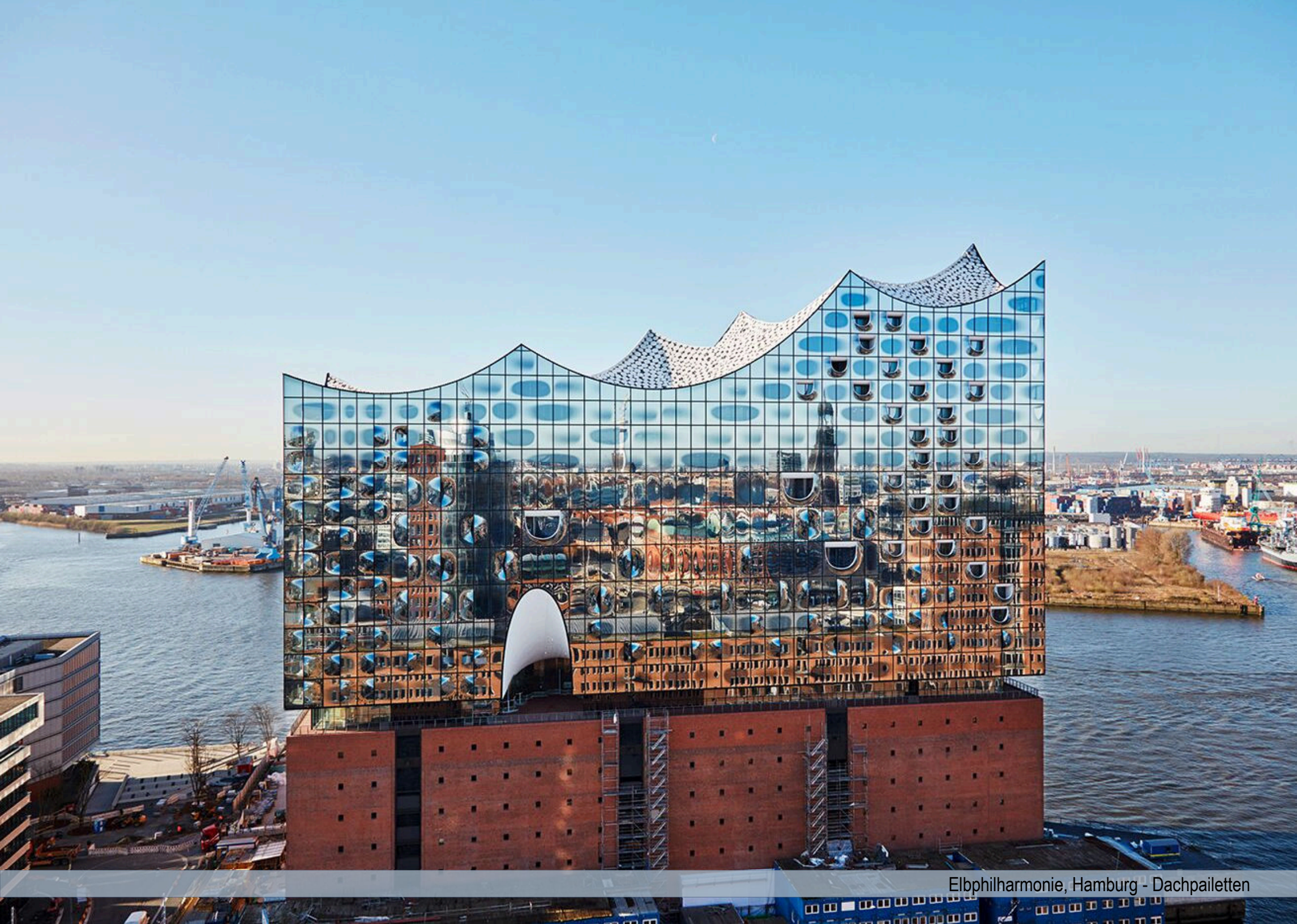
Elbphilharmonie, Hamburg - Dachpaletten