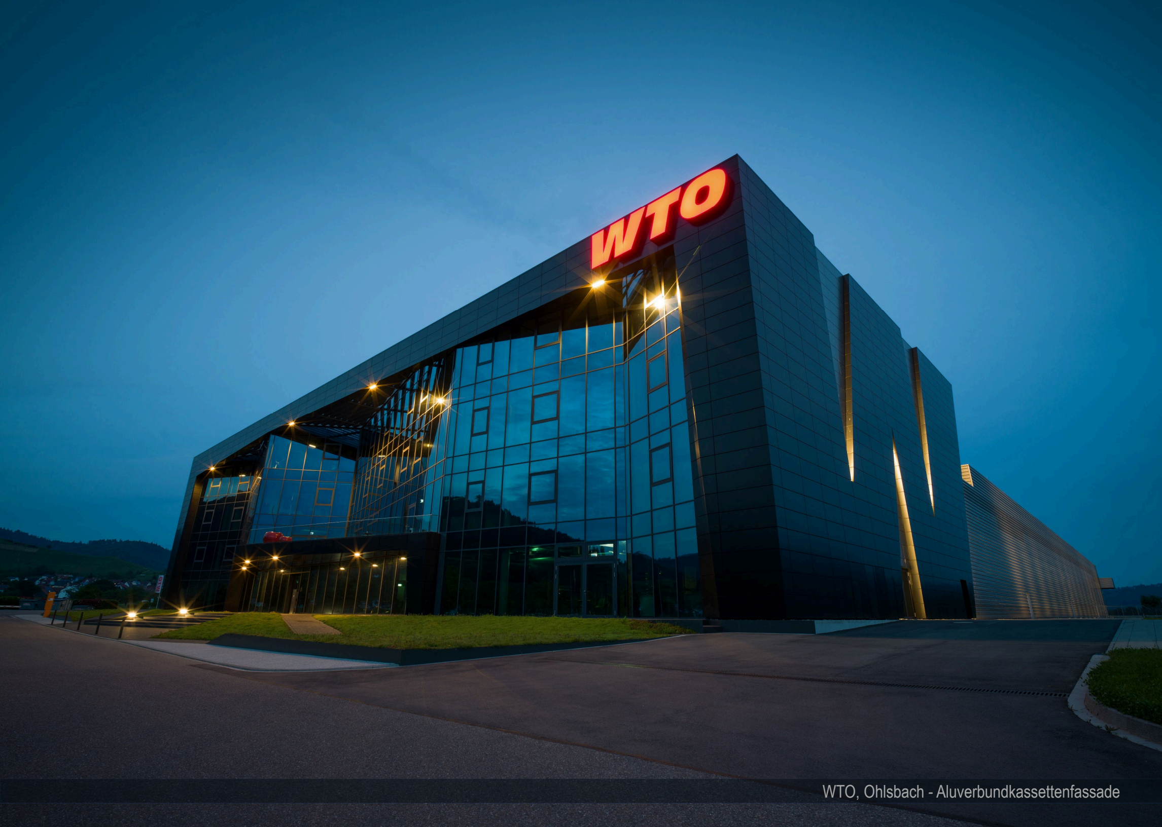
WTO, Ohlsbach - Aluverbundkassettenfassade