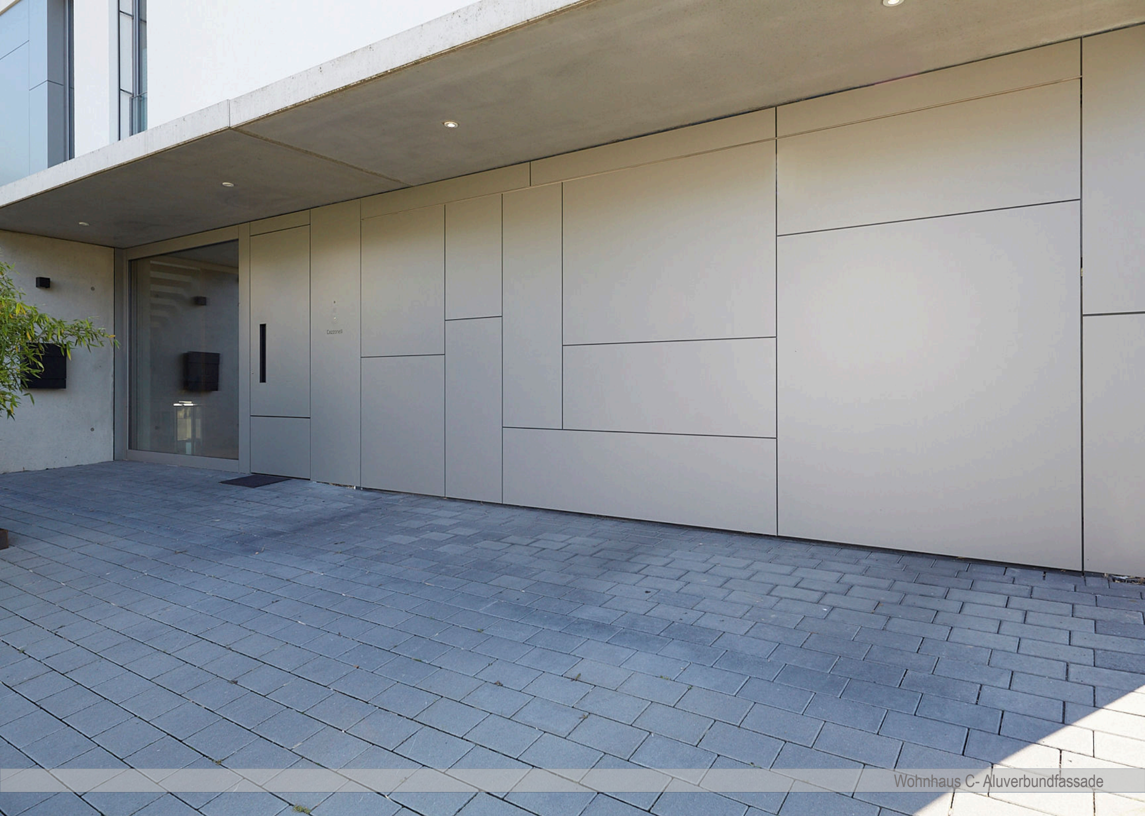
Wohnhaus C- Aluverbundfassade