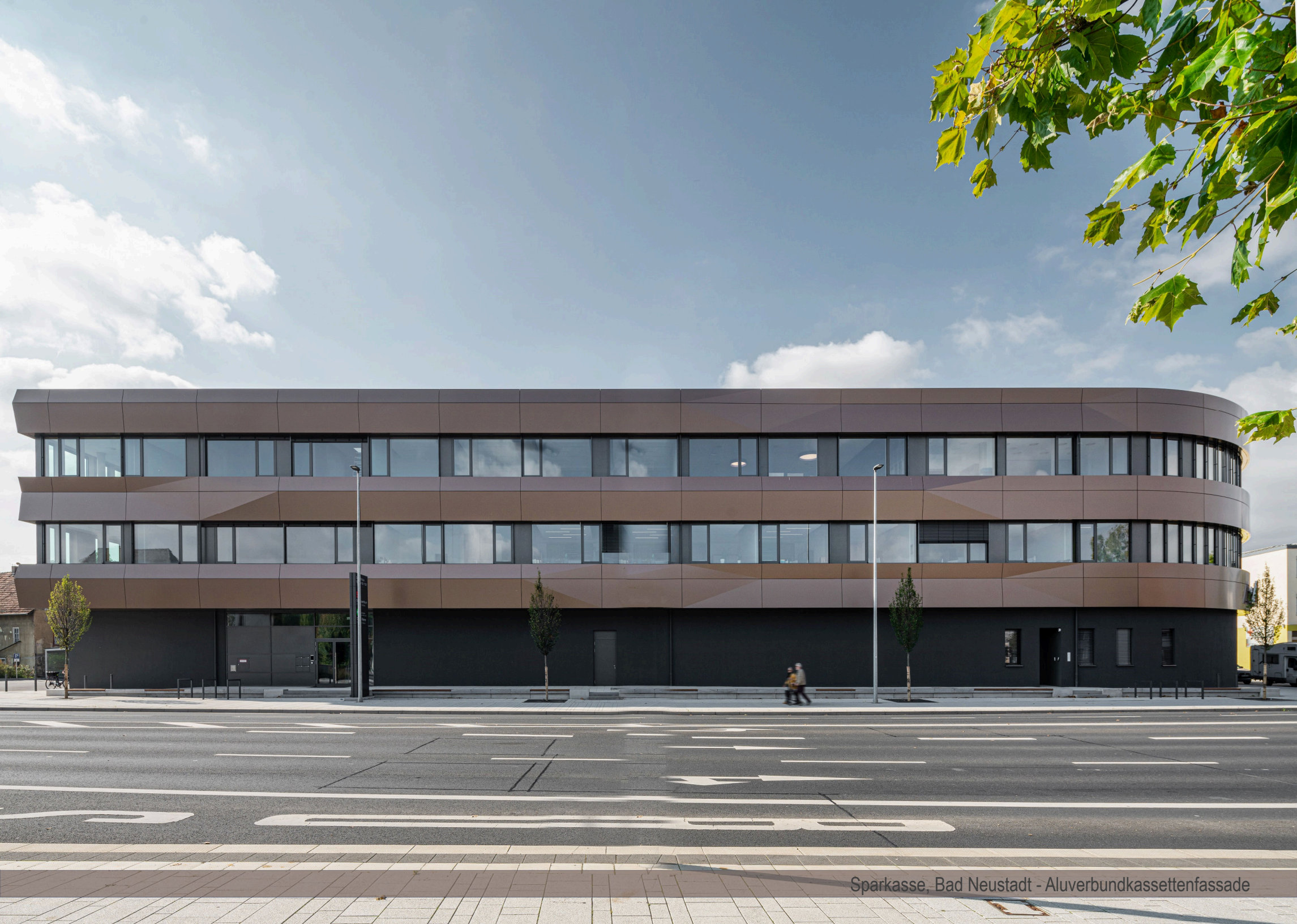
Sparkasse, Bad Neustadt - Aluverbundkassettenfassade