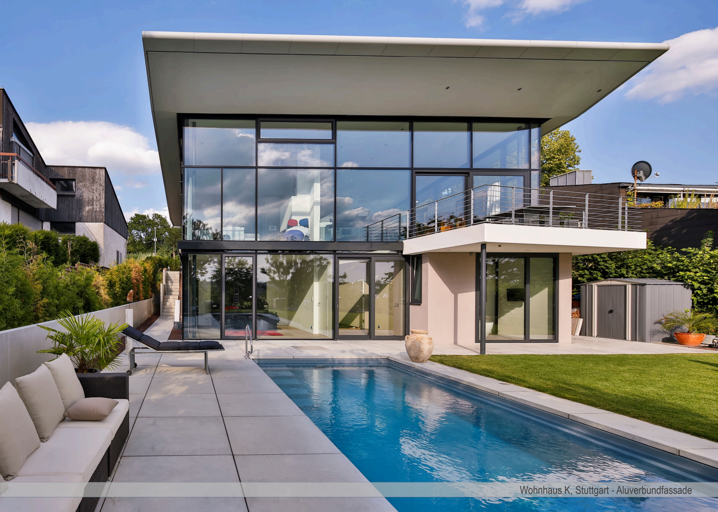
Wohnhaus K, Stuttgart - Aluverbundfassade