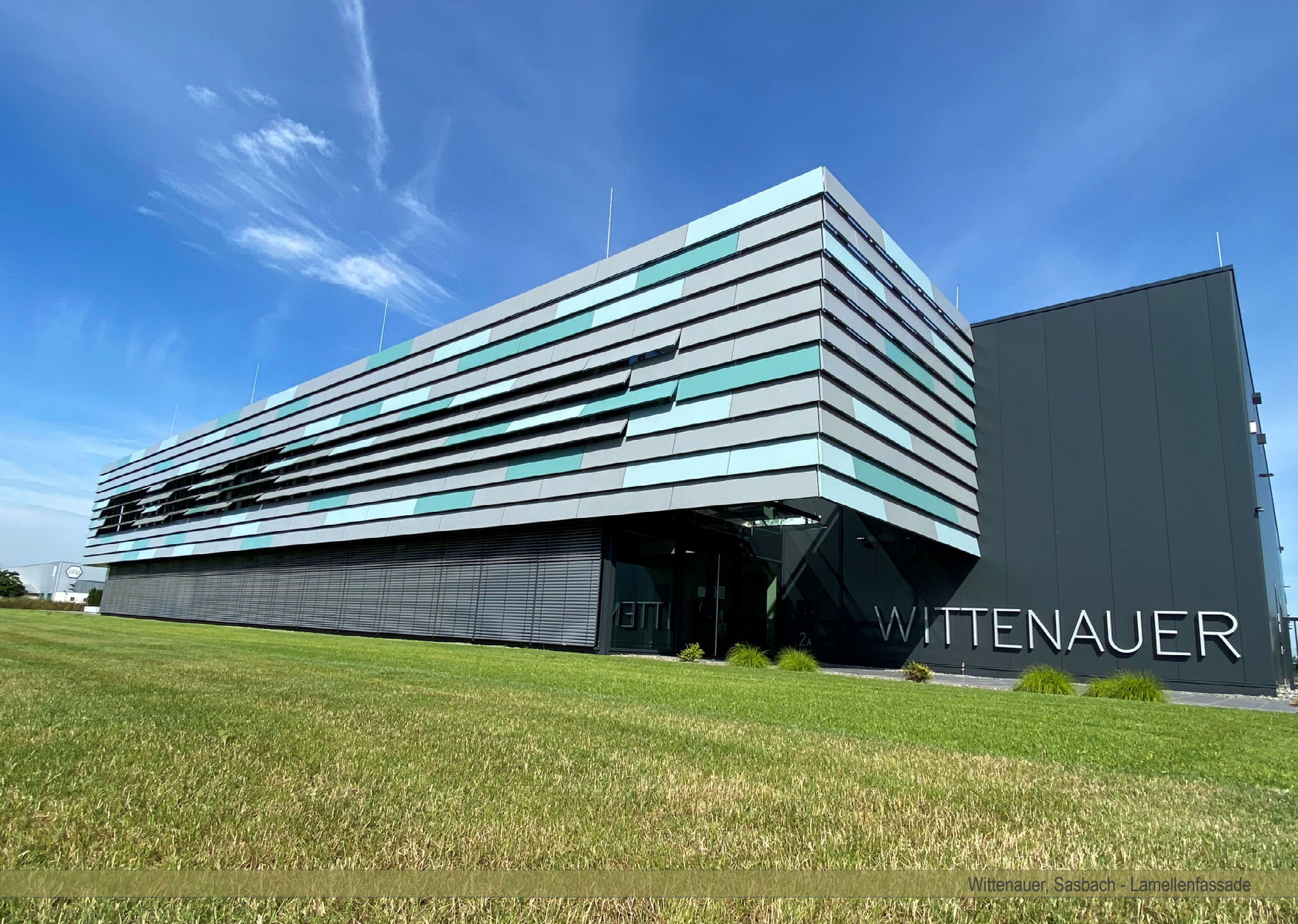
Wittenauer, Sasbach - Lamellenfassade