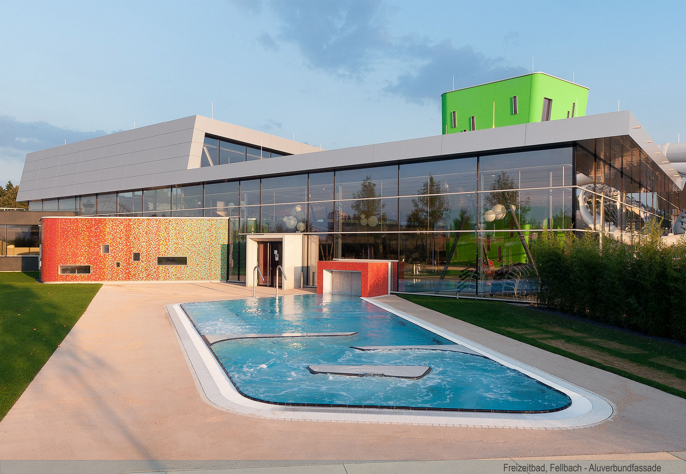
Freizeitbad, Fellbach - Aluverbundfassade