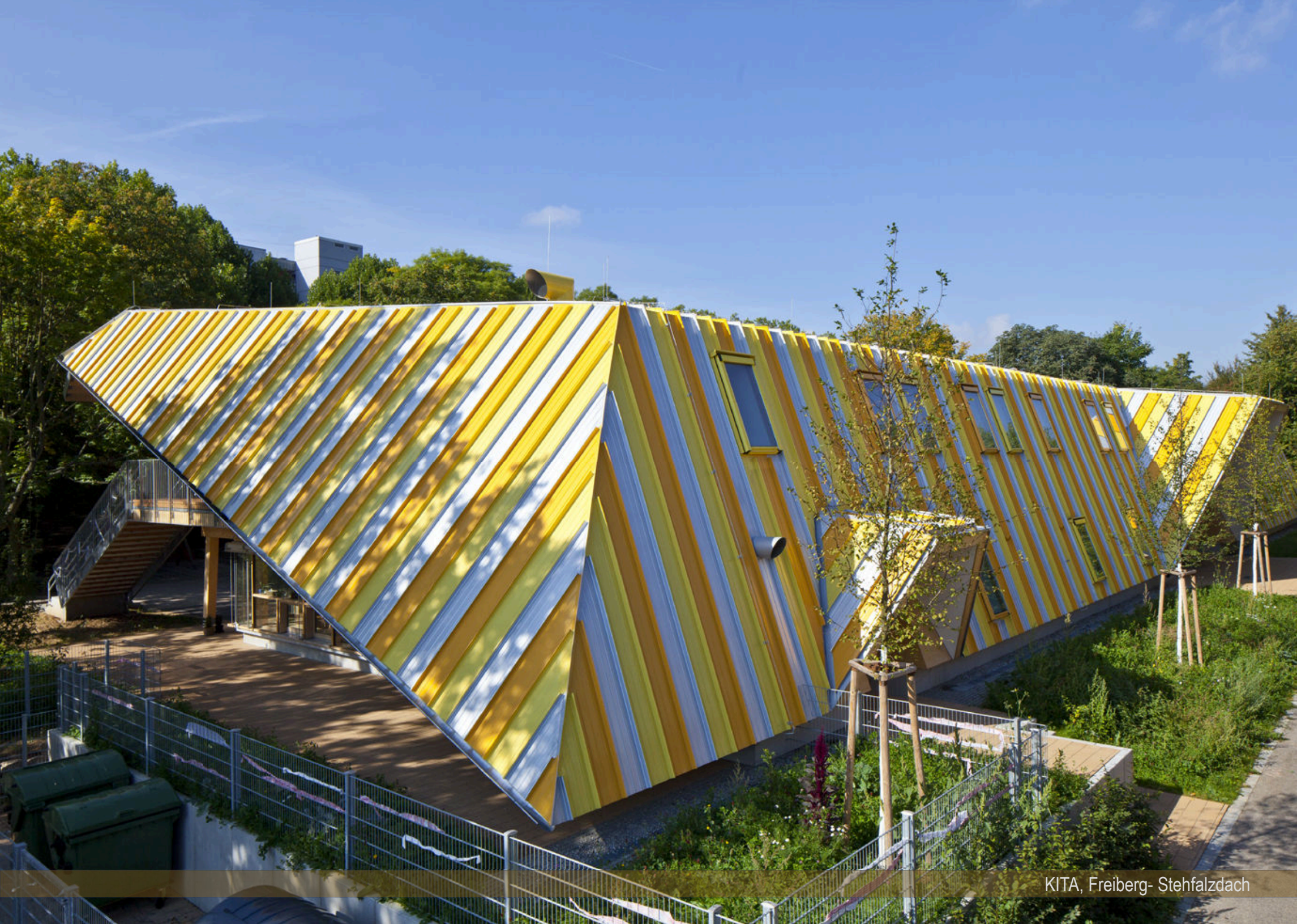
KITA, Freiberg- Stehfalzdach