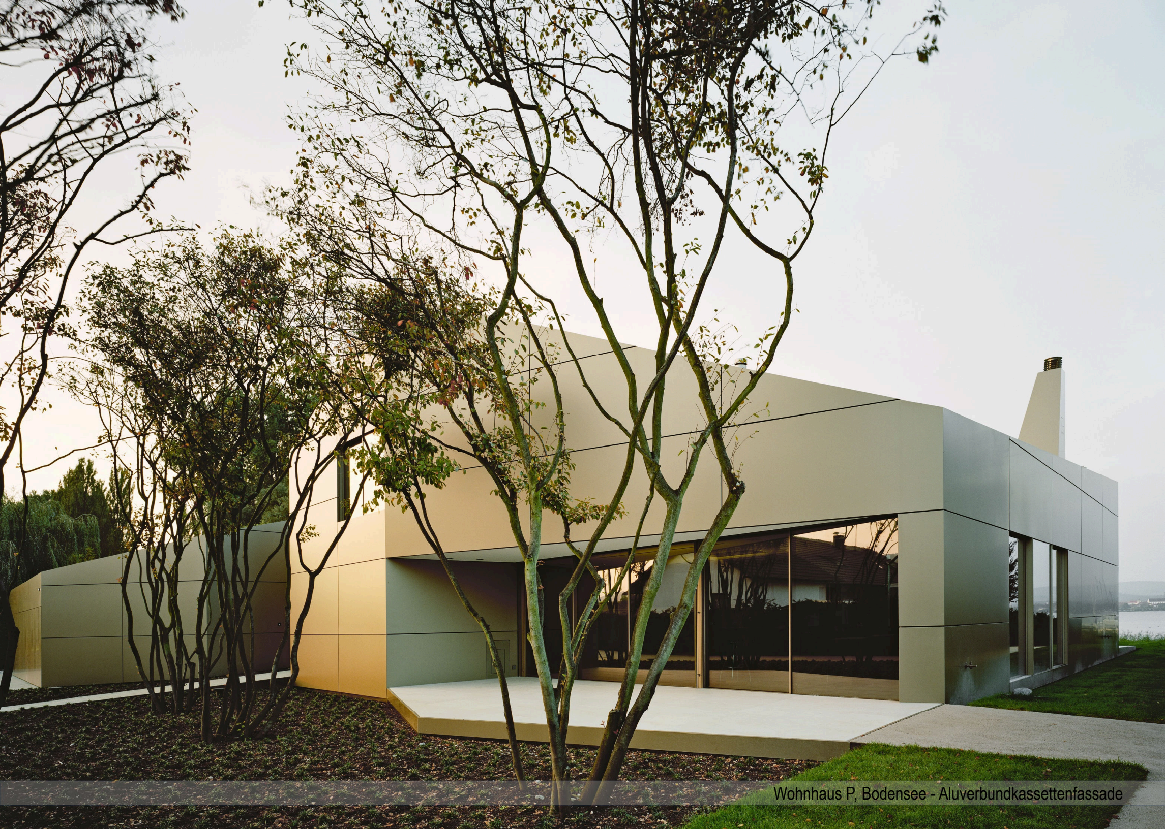
Wohnhaus P, Bodensee - Aluverbundkassettenfassade