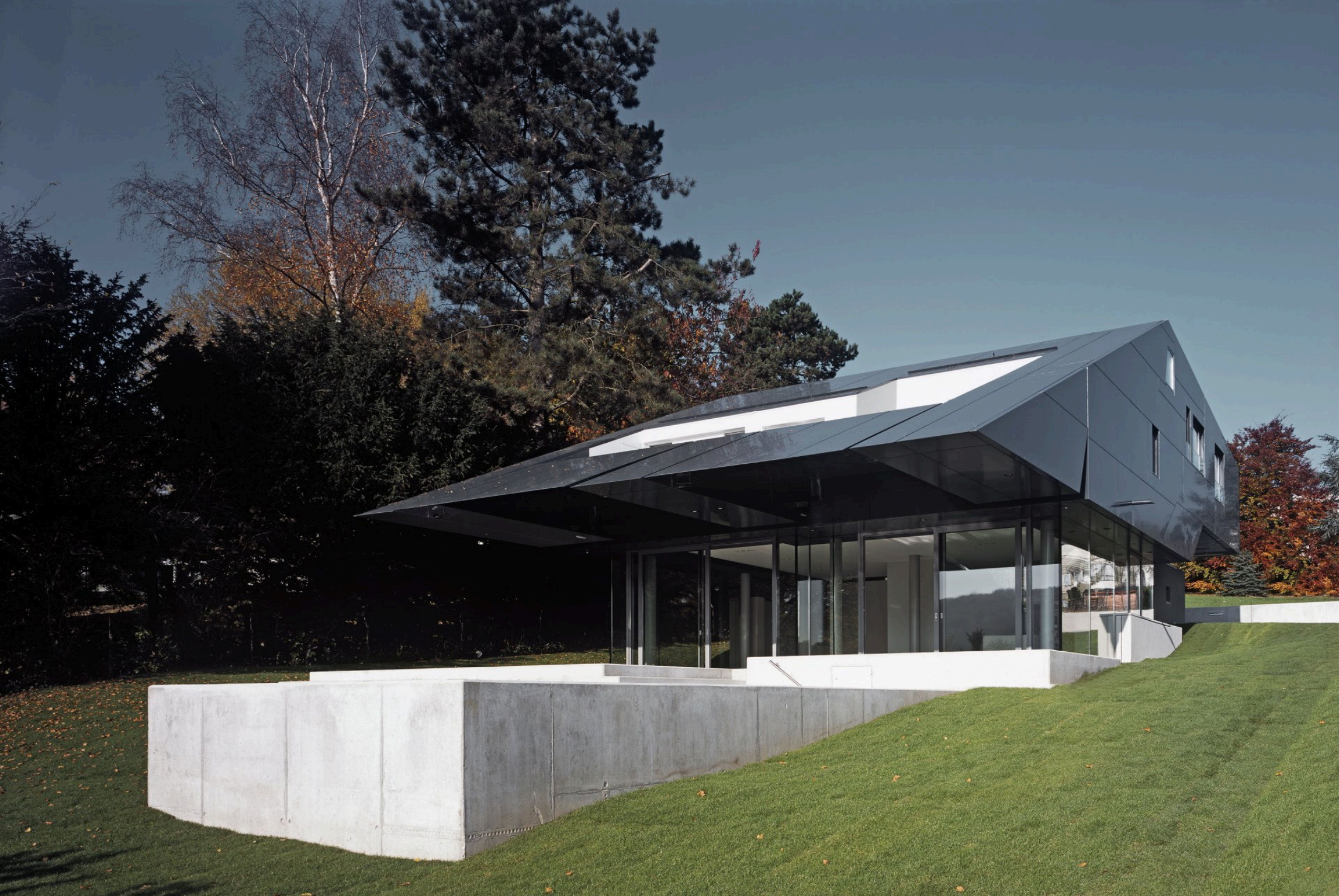
Wohnhaus F, Frankfurt - Aluverbundfassade