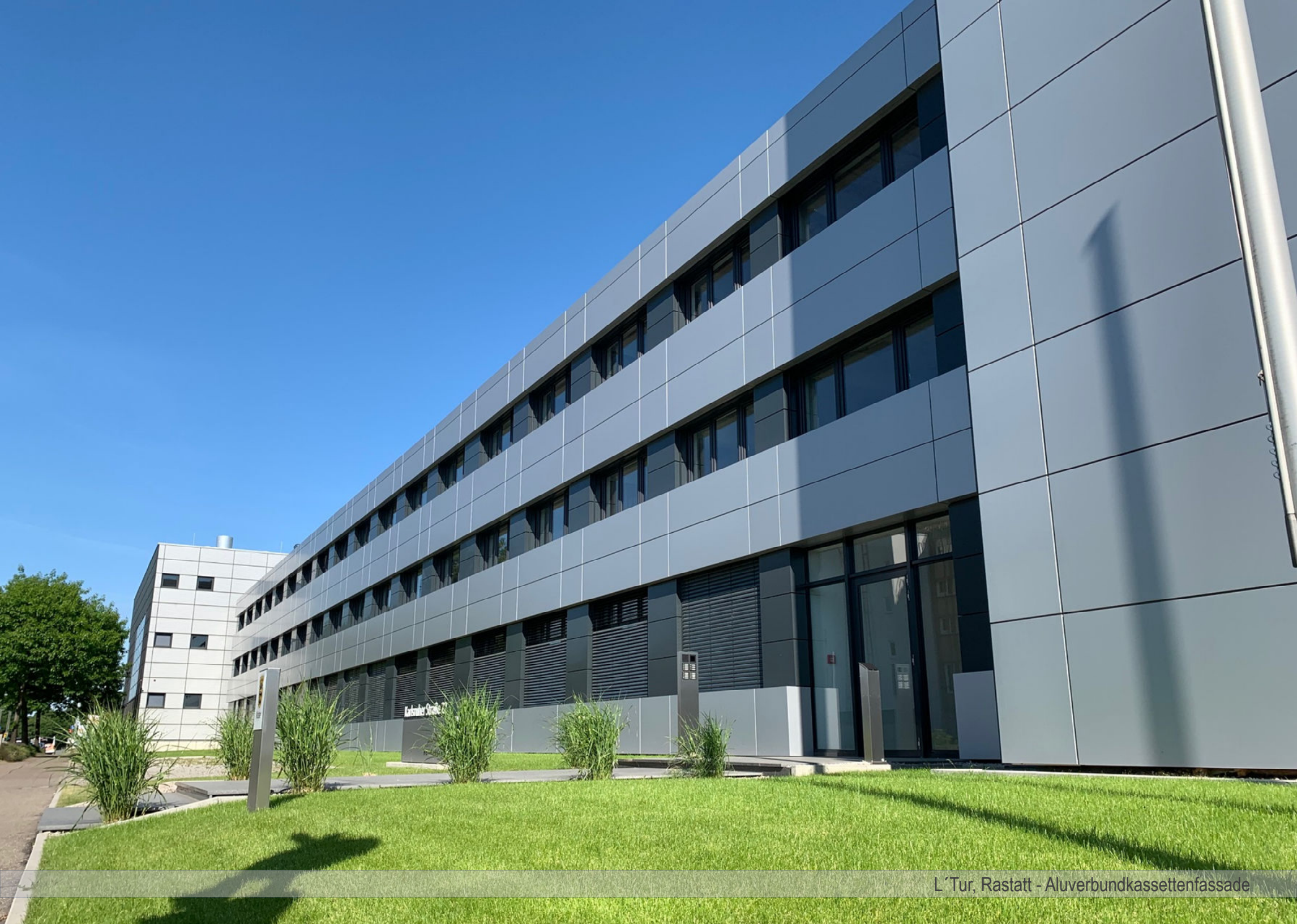
L'Tur, Rastatt - Aluverbundkassettenfassade