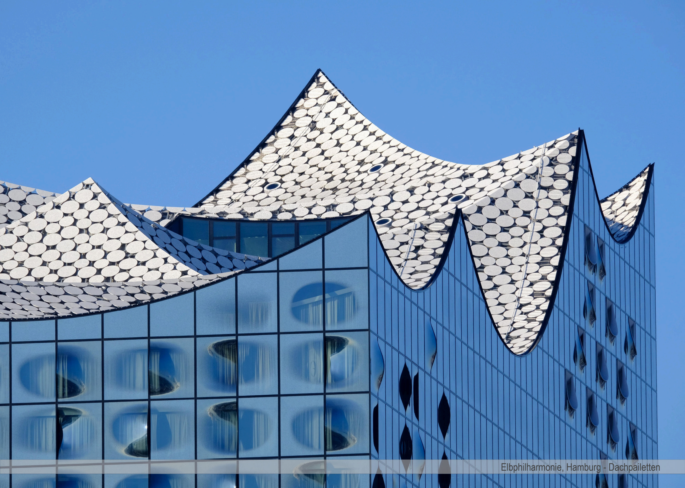
Elbphilharmonie, Hamburg - Dachpailletten