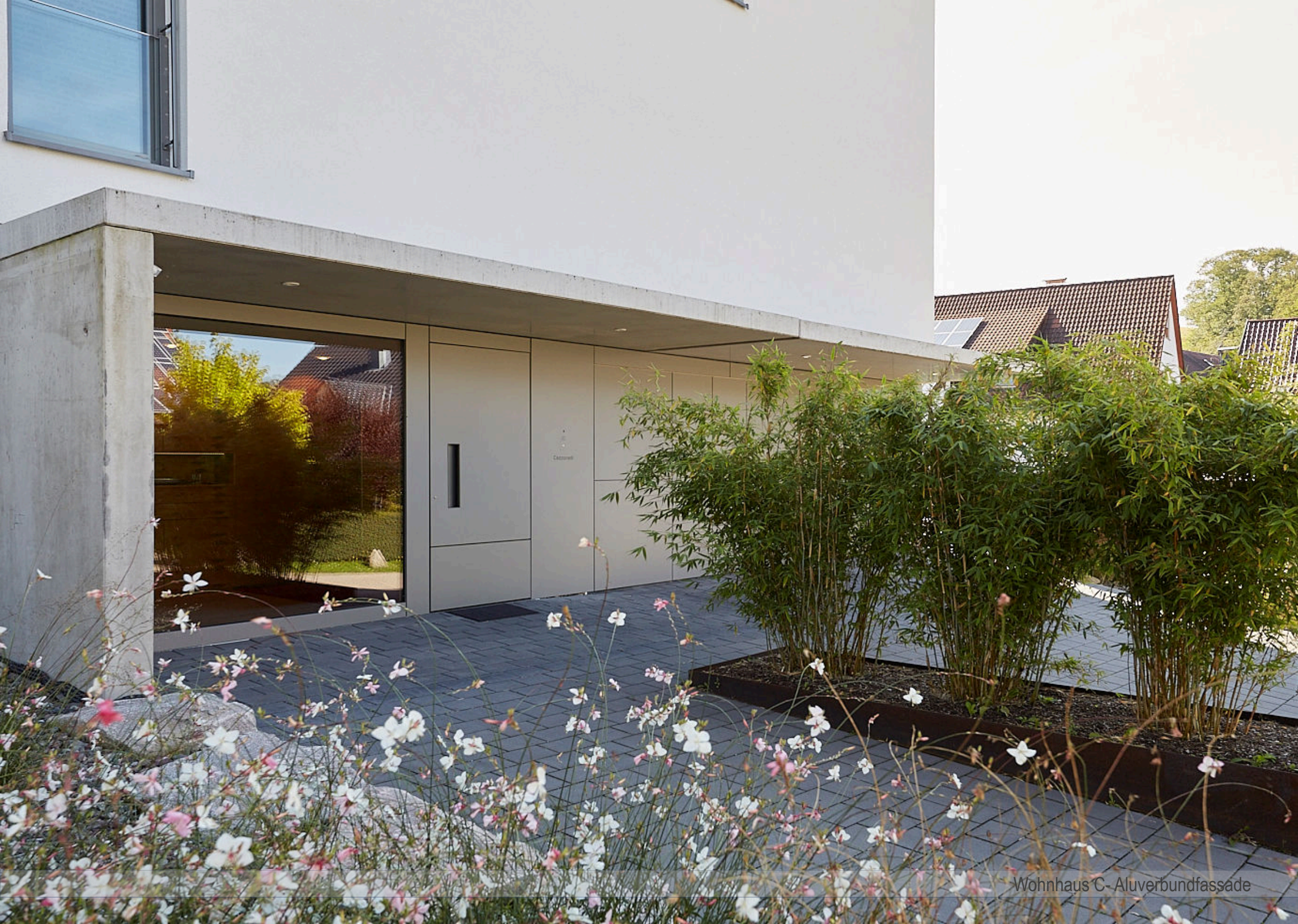
Wohnhaus C- Aluverbundfassade