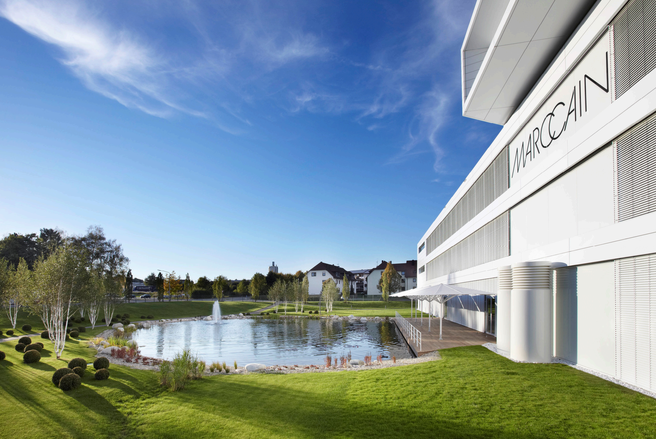
Marc Cain, Bodelshausen - Aluverbundkassettenfassade