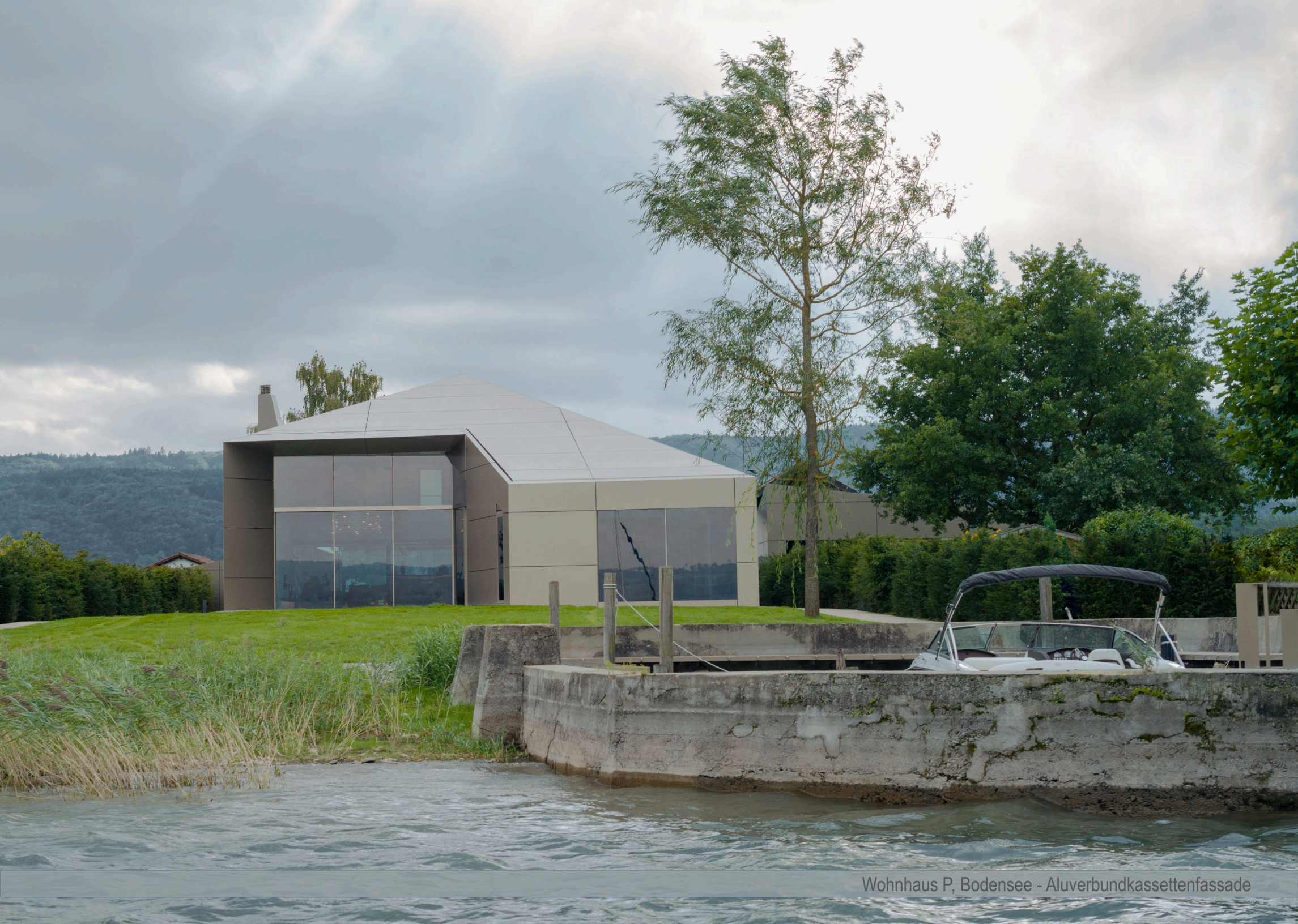
Wohnhaus P, Bodensee - Aluverbundkassettenfassade