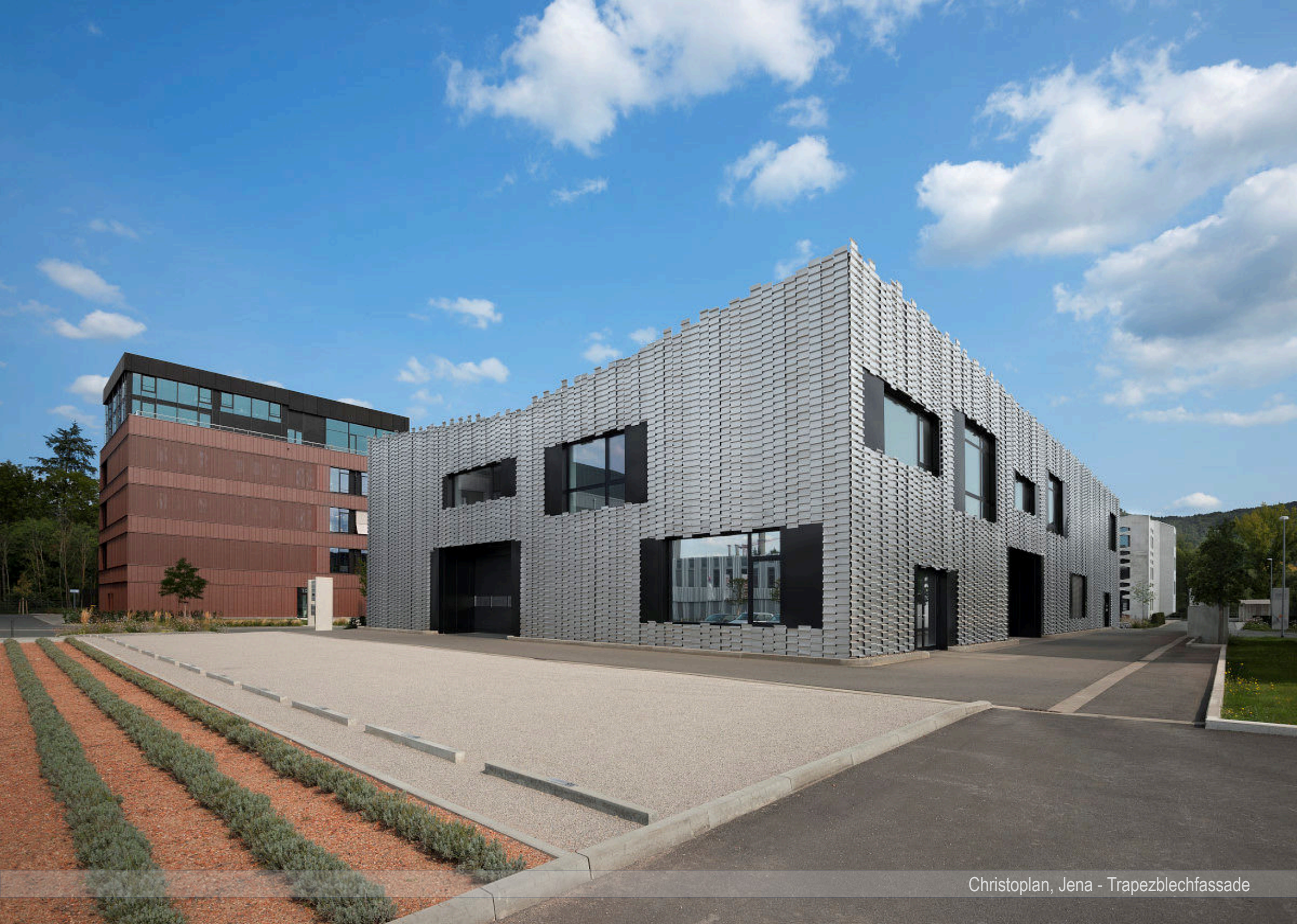
Christoplan, Jena - Trapezblechfassade